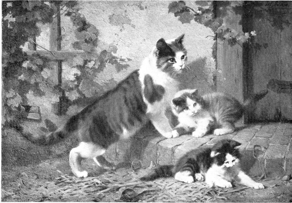
Nach einem Original von Jul. Adam