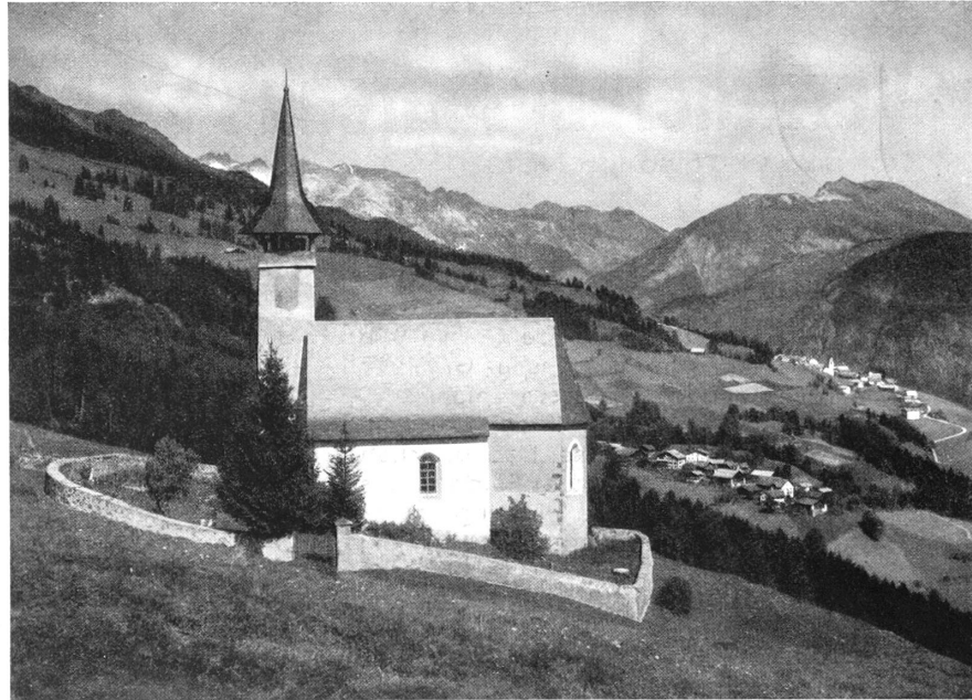
Kirche St. Leonhard von Flerden mit Ausblick auf die Dörfer Portein und Sarn und den Calanda