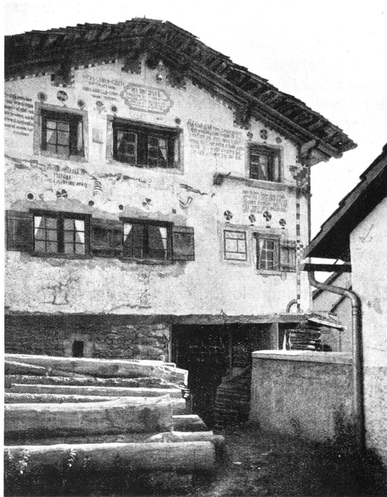
Das alte Pfarrhaus von Präz