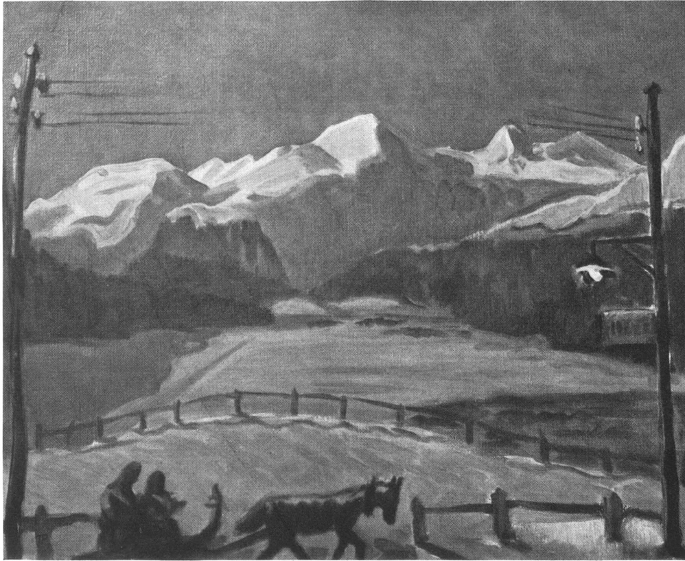
Turo Pedretti: Winterliche Mondnacht (Berninagruppe)

haben und taten alles, dem guten Gelingen den Weg zu ebnen. Sie hießen nach dem Mittagessen die jungen Leute das weitschweifige Gut besichtigen. Dann waren sie für zwei Stunden auf dem Markte abwesend. Kurz und gut: die jungen Leute hatten Zeit und Muße, sich zu unterhalten und die Gefühle gegenseitiger Zuneigung warm werden zu lassen.