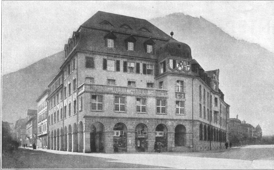
Graubündner Kantonalbank, Chur