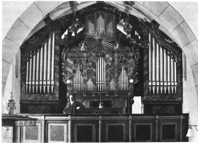
Neue Ilanzer Orgel 1913