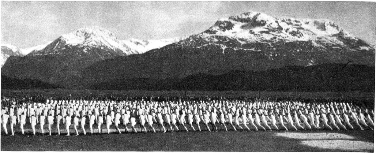
Allgemeine Übungen, Samedan 1934

danken, der für unseren Verband in der Betreuung weiterer Arbeitsgebiete, wie der Vorunterrichtsbewegung, des Jugend-, des Männer-, Frauen- und des Schulturnens beispielgebend und anregend wirkte, während er andererseits vom Bündner Turnwesen die Pflege des sogenannten «volkstümlichen» Wettkampfes übernahm. Das zahlenmäßige Erstarken des Bündner Verbandes spiegelte sich natürlich auch in der Erweiterung aller administrativen Belange, im Auf- und Ausbau des Kurswesens und in der Einsetzung verschiedener Kommissionen. Erstaunlicherweise waren der Jubiläumsveranstaltung vom Herbst 1911 in Thusis bemühende Auseinandersetzungen in den Versammlungen des gleichen Jahres und 1912 gefolgt, gleichsam als Vorboten des kommenden Sturmes von 1914, der die Turnsache in der Folge auf eine ungemein lange und harte Probe stellte. Erst das Jahr 1919 gestattete mit dem Aroser Turnfest wieder ein geschlossenes Auftreten, nachdem 1916 wenigstens für die Einzelwettkämpfer eine Gelegenheit zum Erproben und Messen der Kräfte hatte geschaffen werden können. Die Nachkriegsjahre verlangten dann vielseitige Aufbauarbeit, brachten aber auch scharfe und grundsätzliche Diskussionen um die turntechnische Arbeit. Es ging vor allem um Ausführungsformen im Freiübungs- und Sektionsturnen, außerdem war der Entwicklung auf dem Gebiete der Leichtathletik, dem Einfluß der freien Leibesübun-