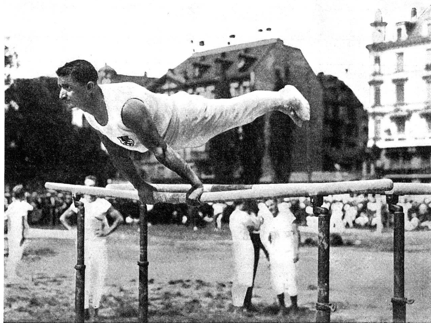
Spitzenleistung bündnerischer Turnkunst: Josef Wilhelm an der Olympiade 1924 in Paris Weltmeister Pferdpauschen

An die Bergdörfer dachte man bei der Verbandsgründung im Jahre 1861 wohl auch, doch waren es nur ganz wenige Gemeinden, in denen das Turnen in der Folge wirklich Eingang finden konnte. Überall waren es zudem ehemalige Studententurner, die das Entstehen einer Turnsektion anregten und auch etwa den Anschluß an den Kantonalverband sicherten. In Maienfeld, in Poschiavo, in Pontresina, in