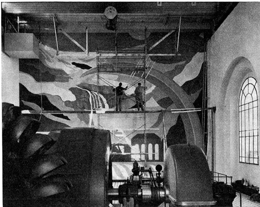
Turo Pedretti: Wandbild in der Zentrale Brusio

Die Rückschau auf die Neuerwerbungen der letzten zehn Jahre zeigt, daß im allgemeinen sehr typische Werke angekauft worden sind und daß es in erster Linie die malerische Qualität war, die bei den Neuanschaffungen den Ausschlag gegeben hat. So stellt die bündnerische Kunstsammlung einen erfreulichen Anfang dar, und es ist ihr zu wünschen, daß sie sich in den nächsten Jahren erheblich erweitern könne und daß ihr bald auch mehr Räumlichkeiten zur Verfügung gestellt werden können, womit ein alter Wunsch aller Kunstfreunde in Erfüllung ginge.