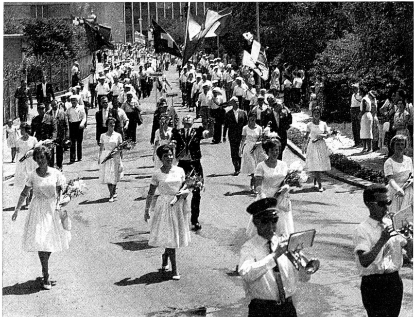
Ausschnitt aus dem Festumzug: Ehrendamen und Ehrengäste an der Spitze

Diesen Veranstaltungen folgten im Festprogramm die Vorführungen der Jungturner, der Frauen und Männerturner, welche auf dem Festplatz bei großem Applaus des trotz der brütenden Sommerhitze recht zahl-