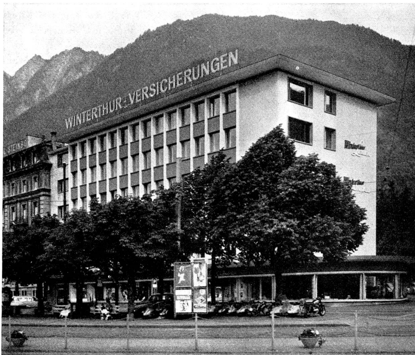
Das neue Verwaltungsgebäude der «Winterthur» am Bahnhofplatz, Chur

Anlage von Kraftwerkbauten. Auch wenn man die Berechtigung, ja Notwendigkeit solcher Bauten anerkennt, fragt man sich nicht ohne einige Besorgnis, wohin diese Entwicklung wohl führt. Andererseits erfüllt es einen mit einer gewissen Genugtuung, wenn man feststellt, daß die maßgebenden Instanzen dieses Problem auch sehen. Anstatt die technischen Anlagen irgendwie zu tarnen und äußerlich in eine Art Palast oder gar Kirche zu verwandeln, wie man dies früher hin und wieder getan hat, ist man heute geneigt, die technisch notwendigen Bauten und Konstruktionen offen zu zeigen; denn diese entbehren ja nicht gewisser ästhetischer Reize, die wir von der Betrachtung moderner Kunst her kennen. Wie gut sich die Welt der Maschinen mit moderner Malerei verträgt, kann ein Beispiel in unserem Kanton eindrücklich bezeugen: der Maschinensaal der Zentrale La Robbia im Puschlav. Die Kraftwerke Brusio AG haben dem Engadiner Maler Turo Pedretti den Auftrag erteilt, ein Wandbild zu schaffen, das von ungewöhnlichen Ausmaßen ist, nämlich 130 m 2 umfaßt. Das Thema lag nahe: die Naturkräfte und ihre Nutzung. Von den Bergen stürzen die Wasserfälle, die im Staubecken gefaßt werden. Unten sehen wir technische Anlagen, über dem Ganzen Wolken verschiedener Dichte und Schwere und einen mächtigen Regenbogen. Mit Recht verzichtet der Künstler auf erzählerische Einzelheiten; denn sein Bild wirkt in erster Linie durch die