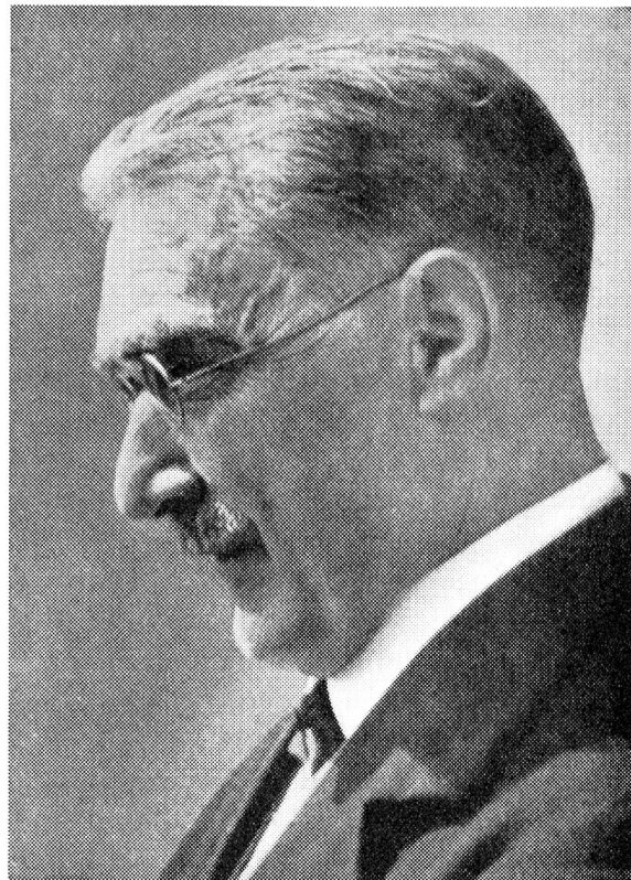
Leonhard Ragaz, Aufnahme aus seinen letzten Lebensjahren

In dieser Geschichte Gottes mit den Menschen fällt aber nach Ragazens Überzeugung auch dem Menschen eine wichtige Rolle zu: «Das Reich Gottes kommt durch die Kraft Gottes, aber es kommt auch durch die Menschen — durch die Zusammenarbeit Gottes und des Menschen.» Aller theologischen Verketzerung dieses Wortes zum Trotz, glaubte Ragaz an eine solche Mitarbeit. Der Mensch kann und soll das Schaffen des lebendigen Gottes in seiner Geschichte mit den Menschen sehen und verstehen; er kann und soll an das in der Bibel verheißene, in Jesus Christus offenbar gewordene Reich Gottes, dieses Vater-Reich, Kindes-Reich und Bruder-Reich, glauben und in solchem Glauben sich seinem Kommen handelnd und kämpfend zur Verfügung stellen. «Christen sind nicht in erster Linie Leute, die eine Weltanschauung zu ver-