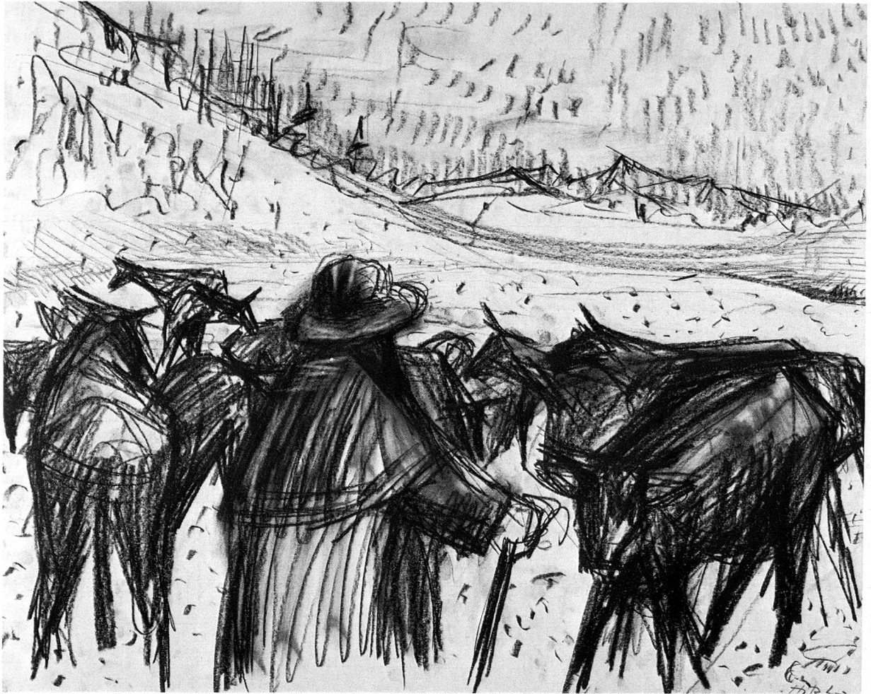
Hitz Leo: Schneehirte, Zeichnung, 52 × 42 cm