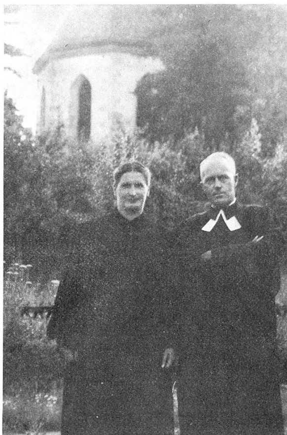
Im Pfarrgarten Kilchberg.