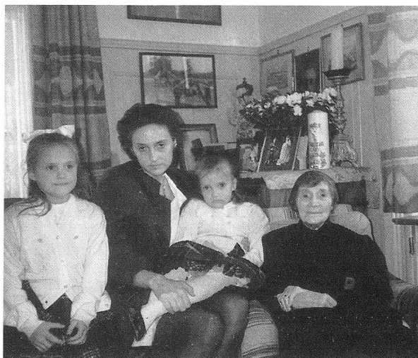
4. Januar 1989 in Zizers

In der Kaisergruft der Kapuzinerkirche in Wien wurde eine grosse Frau bestattet, die in den vielen Jahrzehnten alle Wechselfälle des Lebens mit einem unerschütterlichen Gottvertrauen und mit beispielhaftem Starkmut gemeistert hat.