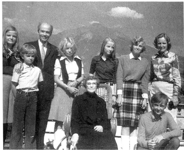
11. September 1974 in Zizers

In Sarajewo, der Hauptstadt von Bosnien im heutigen Jugoslawien waren am 28. Juni 1914 Erzherzog-Thronfolger Franz Ferdinand und seine Gemahlin Sofie ermordet worden; Karl von Habsburg wurde Thronfolger. 86 Jahre alt, nach einer Regierungszeit von 68 Jahren, starb am 21. November 1916 Kaiser Franz Joseph. Der 29 Jahre alte Karl wurde als Karl I. Kaiser von Österreich; Zita wurde Kaiserin. Der junge Kaiser musste in sehr schwerer Zeit sein hohes Amt antreten: Europa stand mitten im Ersten Weltkrieg; schon Millionen von Toten und Verletzten waren die Opfer des Krie-