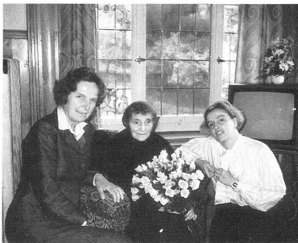
9. Mai 1988 in Zizers

Nicht nur Landesmutter ist Kaiserin Zita gewesen, sondern auch hochverehrte, sehr geliebte Mutter einer zahlreichen Nachkommenschaft: Mutter von fünf Söhnen und zwei noch lebenden Töchtern, Grossmama von 32 Enkeln und Enkelinnen, Urgrossmama von derzeit 48 Urenkelkindern.