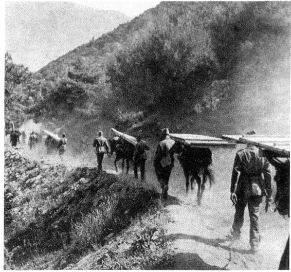
Auf dem Marsch in die Berge.