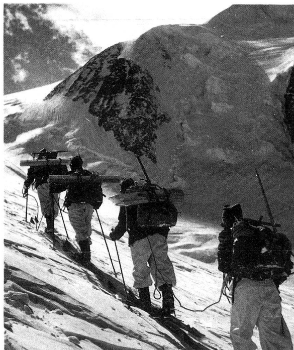
1940 Schwerbepackte Spurpatrouille im Aufstieg zum Piz Bernina: Ski, Stöcke, Steigfelle, Rucksäcke sind ziviles Privatmaterial. Die Armee besitzt aber bereits weisse Tarnanzüge.