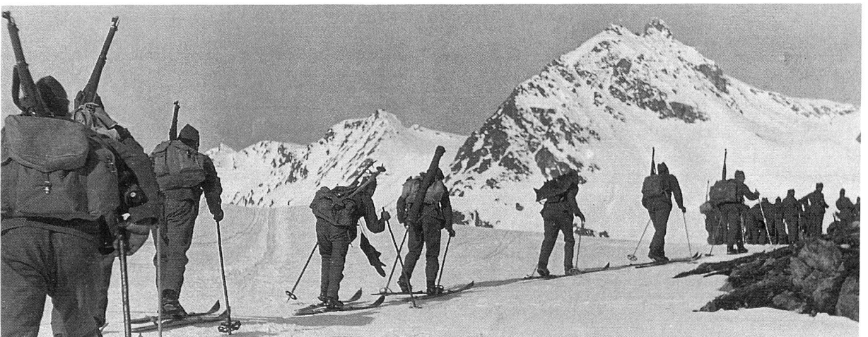
Das Geb. Füs. Bat. 92 auf dem Marsch von Davos über den Scalettapass nach Scuol.