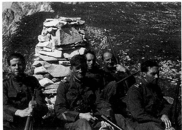
An der Front.

Die Truppe musste die bundesrätlichen Verlautbarungen dahingehend auffassen, dass die Eidgenossenschaft nunmehr nach praktisch beendetem Krieg ihre Abwehrbereitschaft einschränken werde. Aus der Rede von Pilet-Golaz war die Absicht einer «teilweisen und stufenweisen Demobilmachung» zu vernehmen. In den Einheiten wurde dies vereinzelt fälschlicherweise als Aussicht auf baldige Entlassung interpretiert. Dazu kam es für die bündnerischen Einheiten nicht, vielmehr er-