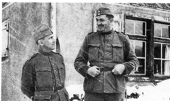
Zwei Angehörige der Mannschaft.