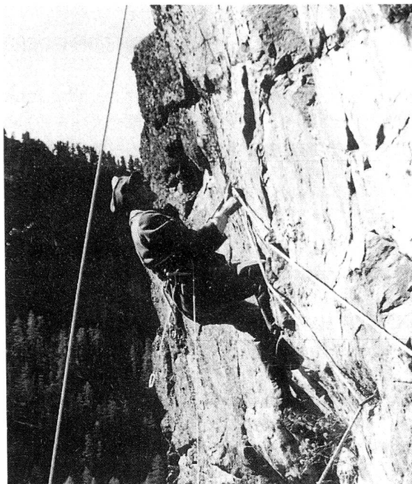
1940 Schon Kletterei mit Seilzug im Militär. (Gg. Calonder)