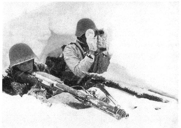
Gefechtsausbildung im Winter.