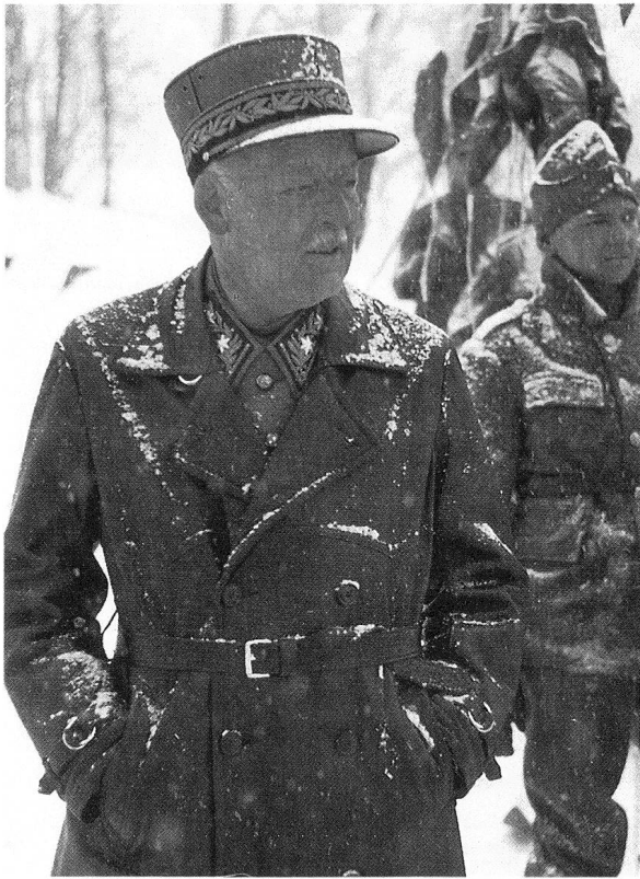
Oberstkorpskdt. Renzo Lardelli.

bekannte er sich in den landeswichtigen Auseinandersetzungen um eine Strassenverbindung Glarus–Graubünden, die noch im Gang waren, entgegen seiner vorgesetzten Behörde zu einer Segnesstrassenverbindung, nicht zur Kistenpasslösung, wie Generalstab und Bundesrat sie verfochten. Nicht vergessen dürfen wir schliesslich, dass Lardelli einer der frühesten und nachdrücklichsten Förderer der militärischen Hochgebirgsausbildung der Truppe war.