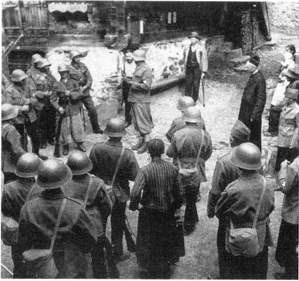
Befehlsausgabe im Bergdorf.