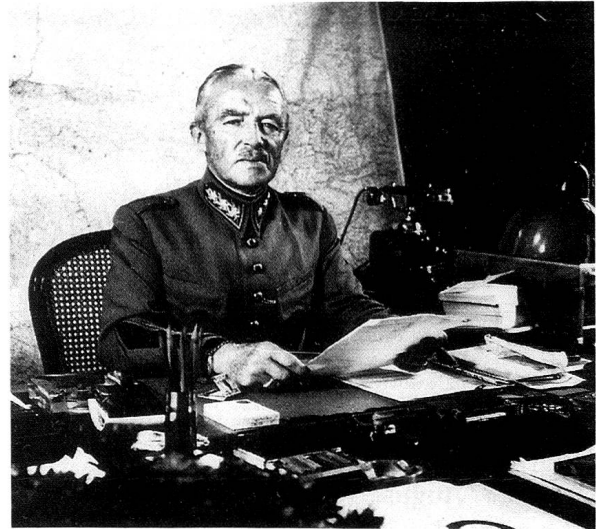
General Henri Guisan.

Dem Schwachen zum Schutz, dem Übermütigen und Gewalttätigen zum Trutz wollen wir unsere Heimat ver-