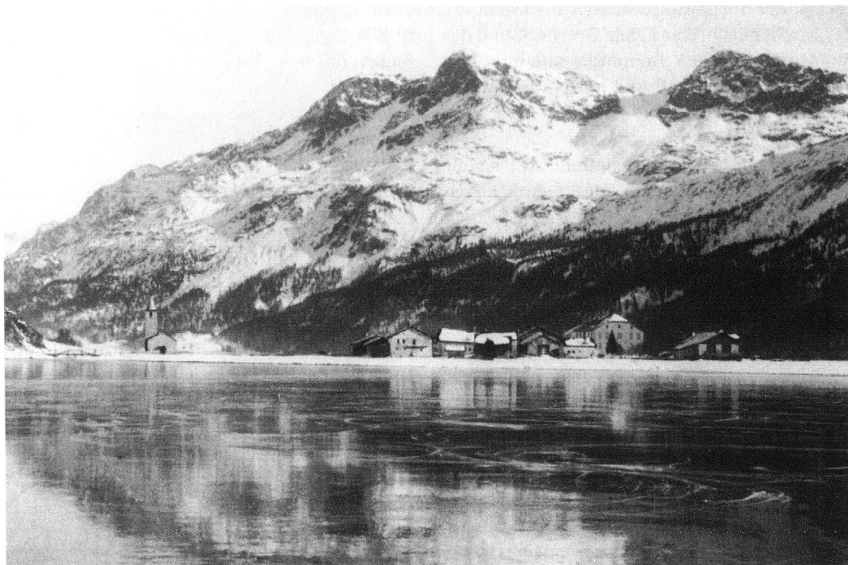
Sils Baselgia um 1880.