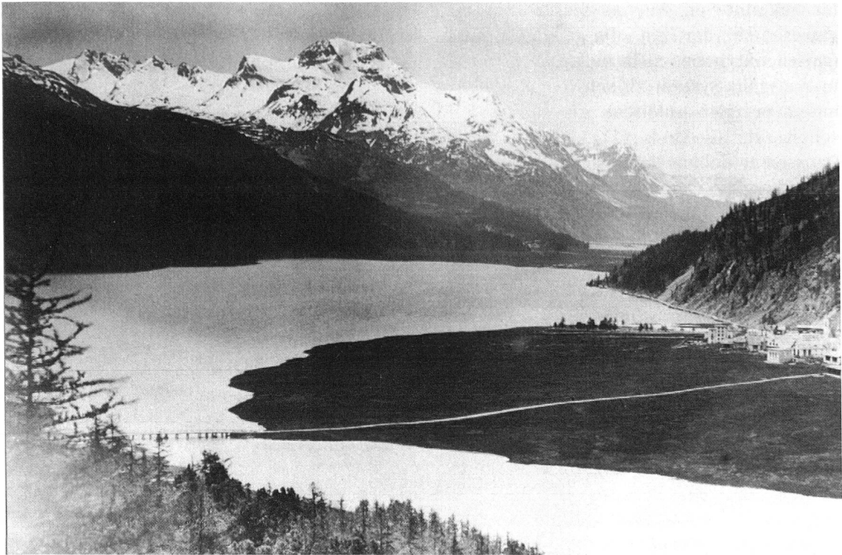
Silvaplana um 1880.