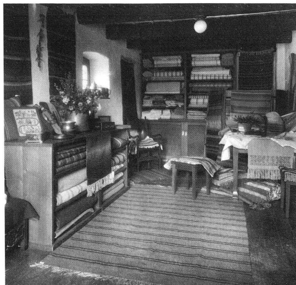
Erster Verkaufsladen der «Bündner Zentralstelle für Heimarbeit» an der Engadinstrasse (Haus «Sonnengrund» Juni 1930 – Dezember 1931). (Foto: Archiv Bündner Heimatwerk Chur, BHW).

In der Zwischenzeit war in Zürich das Schweizer Heimatwerk gegründet worden; vorerst übrigens als Abteilung des Schweizerischen Bauernverbandes und somit ganz im Sinne der Kommission Baumberger! Welch eminente Bedeutung den Ideen und Bestrebungen des St. Galler CVP-Nationalrats Dr. G. Baumberger im Dienste des Berggebietes und der Hochtäler letztendlich zugemessen wurde, das mag vielleicht erahnen, wer auf dem Piz Calmut am Oberalppass beim Granitkreuz steht, das zu seinen, Baumbergers Ehren errichtet wurde. Es trägt die Inschrift «EX MONTIBUS SALUS» und blickt in allen vier Richtungen weit in die Alpenketten; fürwahr ein hehres, stolzes, trutziges Memorial!