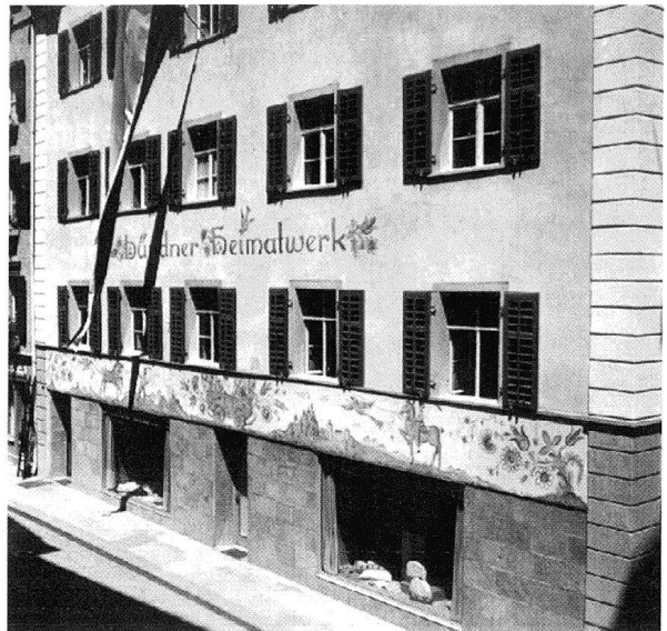
12. Oktober 1948: Einzug ins eigene Haus am Mühleplatz 5. Zeittypische Fassadenmalerei von Annina Vital.

Womit wir bereits mitten in den Bauarbeiten vom Sommer 1948 wären. Das erworbe-