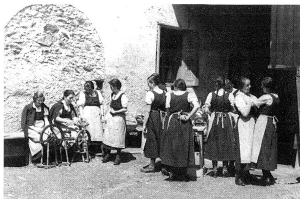
Spinnerin-Gruppe, unbemerkt (!) aufgenommen in der Arbeitspause (Sta. Maria, 26. Mai 1937).