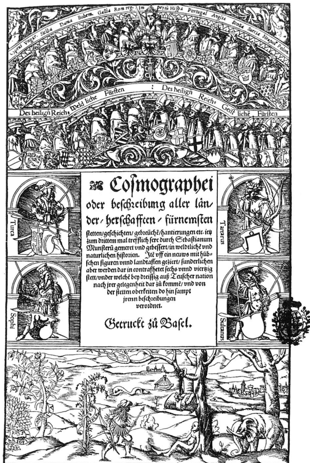
Sebastian Münsters Kosmographie. Titelblatt nach dem Reprint von 1988

lich angeschlagenen Lesern die Hoffnung erweckte, dass auch sie von ihren Leiden befreit werden könnten, beendet Münster seine Schilderung des Heilbades von Pfäfers.