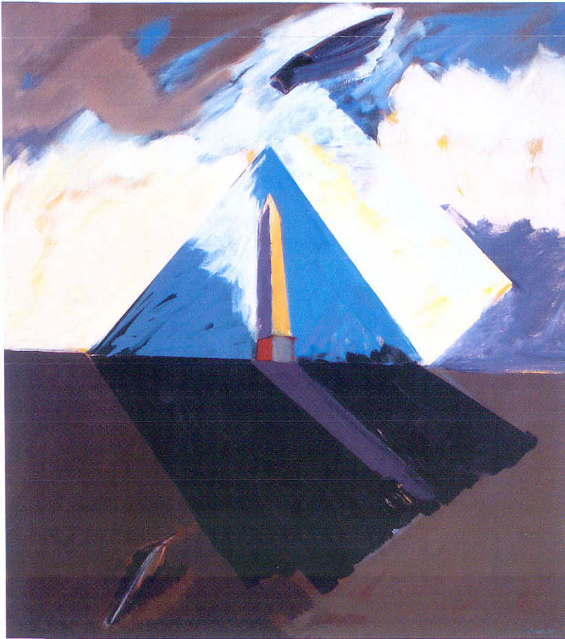
«Mediterraneo», 1979, Öl auf Leinwand, 110 x 100 cm.