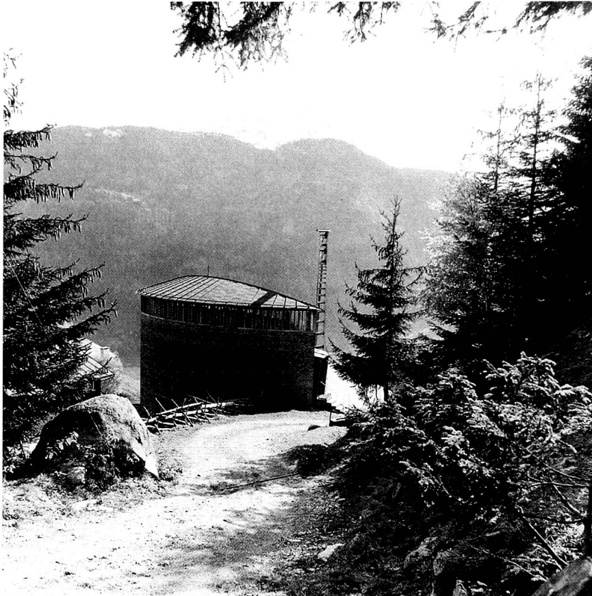
Sogn Benedetg.