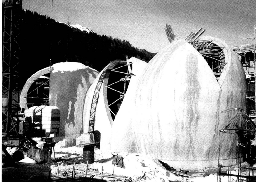
Bauruine – Baustopp, Evangelische Kirche Cazis. (Foto R. Härdi, Oktober 1996)