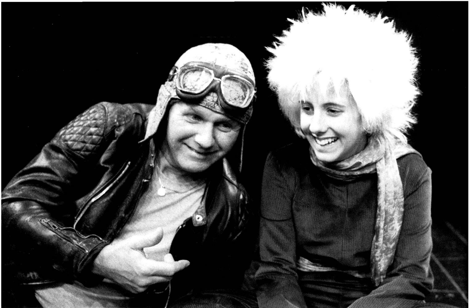
Szene aus «Der Kleine Prinz», Theaterprojekt Procap Grischun, Freilichtspiel in der Klinik Beverin, Cazis im Mai/Juni 2003.

Schulen integrieren zu können. Durch die im Jahr 2000 erfolgte Teilrevision des kantonalen Behindertengesetzes sind die gesetzlichen Grundlagen für die Integration behinderter Kinder in das öffentliche Kindergarten- und Schulsystem geschaffen worden. Im Jahr 2003 konnten 34, d.h. 10% aller Sonderschulkinder ganz oder teilweise integriert geschult werden.