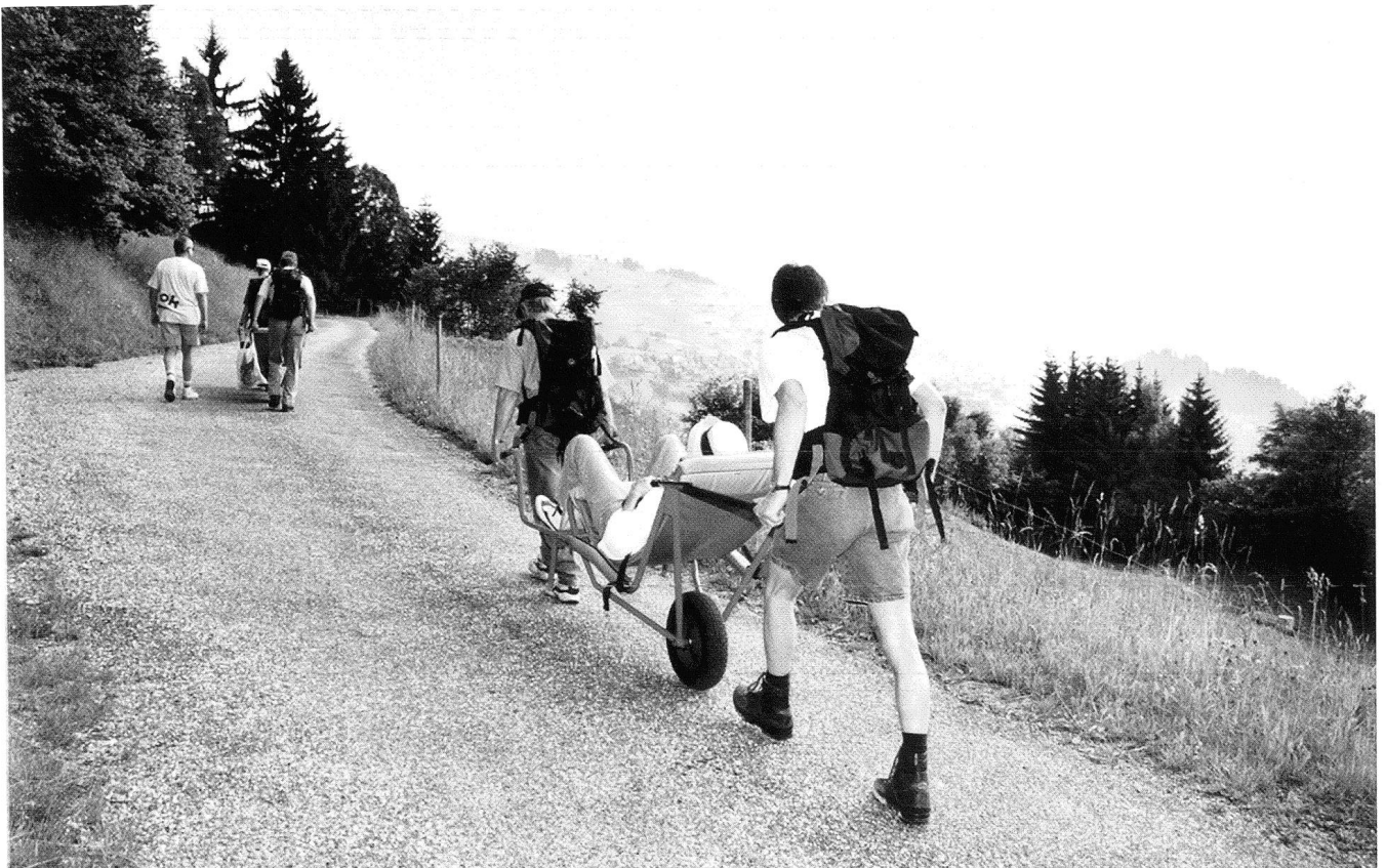
Trekking-Wanderung in der Surselva im Sommer 2001.

Nach Art. 8 der seit dem 1. Januar 2000 geltenden Bundesverfassung (BV) darf niemand namentlich wegen einer körperlichen, geistigen oder psychischen Behinderung diskriminiert