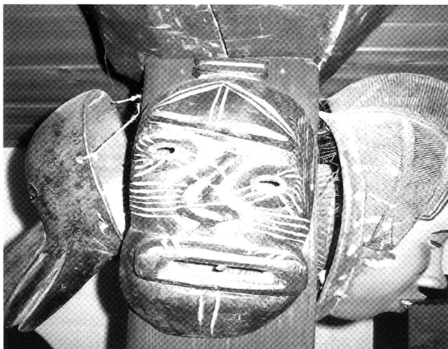
Inuitmaske, Mitte.

ganze Völkerstämme gibt, die Ehrgeiz und Habsucht vom Morgen bis zum Abend fieberhaft hinter einem Dämon herjagt, [...] dem Dämon Geld [...] Wie dir erklären, dass es Völker gibt, die aus Habsucht über ihre Landgrenzen greifen, Soldaten mit Kugeln und Bomben hinausschicken, andere Völker zu vernichten und deren Land für sich zu nehmen [...]? Menschen, die ihrem Ehrgeiz, ihrer Habsucht und ihrer Technik die Seelenruhe, den Frieden, das Leben opfern.» 13