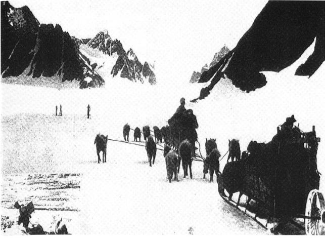
Schweizer Illustrierte Zeitung vom 23. November 1938, Nr. 47, S. 2: Die schweizerische Grönlandexpedition, 1938.

Männer nichts Höheres, Edleres kennen, als euch, äonenlang trotzende, starke Berge zu lieben. Euch Zeit ihres Lebens zu dienen, bis zum letzten Atemstoss. 10