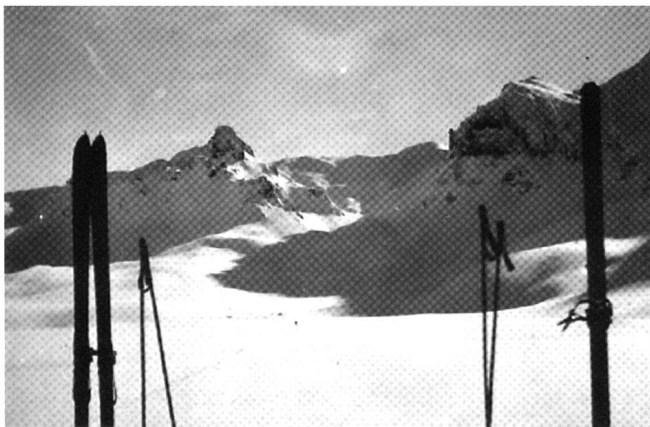
Aus dem Foto-Album von Guido Piderman. (Archiv Mario Piderman)

E cur ch'eu sarà morta Chi badarà ch'eu nu sun plü? Forsa il sulai Perche eu nu clei plü Seis razz Forsa il vent Sch'eu nu til quint plü Mia istorgia Quels m'han acceptada Quella ch'eu sun.