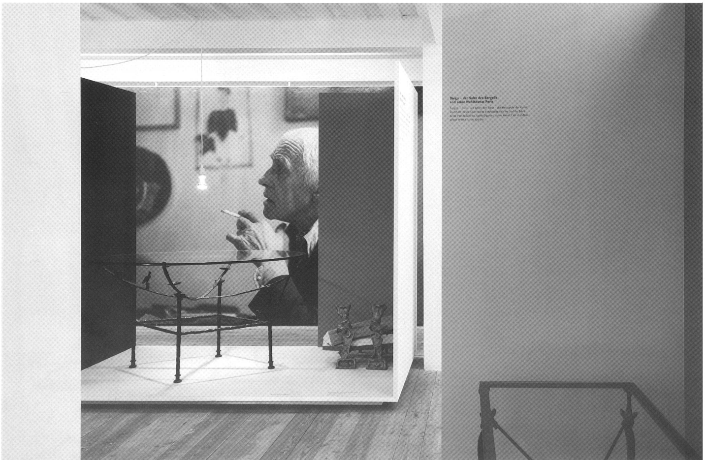
Sonderausstellung Diego Giacometti im Gelben Haus, Flims.

Die Sonderausstellung «Diego Giacometti tritt aus dem Schatten» wurde im Winter 2007/2008 im Gelben Haus in Flims gezeigt. Diegos Name ist untrennbar mit demjenigen seines Bruders Alberto verbunden. Lange Zeit trat er in der Kunstwelt nur als Albertos Modell in