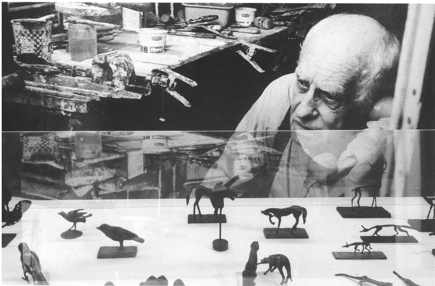
Sonderausstellung Diego Giacometti im Gelben Haus, Flims.

Klein, Alexander: Das Wohnen bei den Dingen, in: Kunstforum, Band 186, 2007.