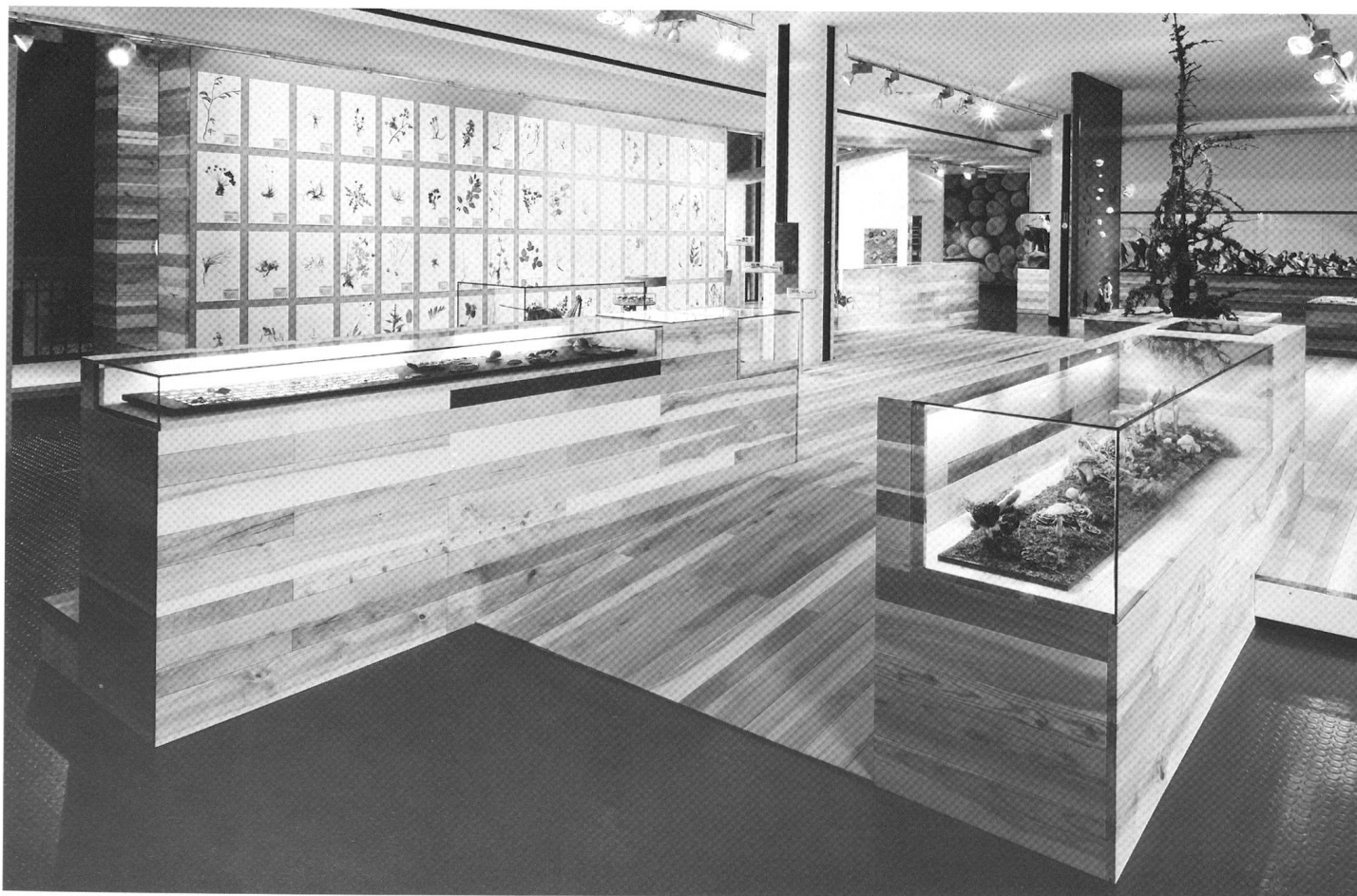
Neue Dauerausstellung im Bündner Naturmuseum, Chur.

Und wie stellt man eine solche Artenvielfalt aus? Man nutzt eben diese Vielfalt und komponiert daraus neue, aussagestarke Bilder: So werden 3000 Schmetterlinge auf hellblauem Hintergrund in einer vier Meter breiten Wandvitrine präsentiert. Die Besucherin taucht beim Anblick in eine Welt der Farben und Muster ab und wird selbst ein Teil der Inszenierung. So sind auch die rund 150 Vögel nicht nach Gattungen ausgestellt. In einer neun Meter langen Vitrine wird vom grössten Greifvogel bis zum kleinsten Singvogel auf eindruckliche Weise die Artenvielfalt