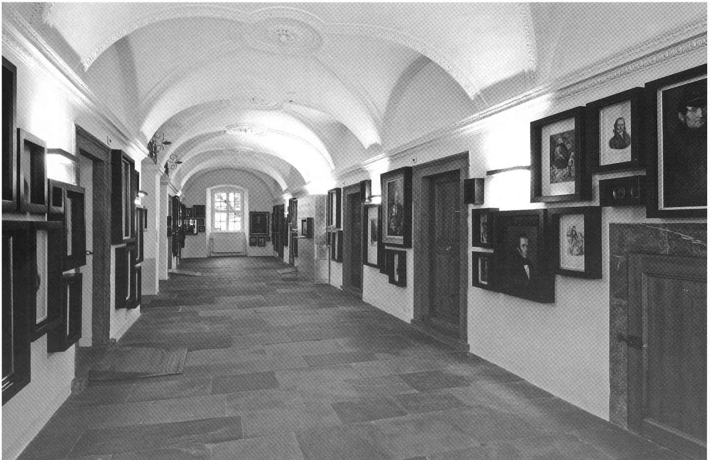
Neue Dauerausstellung im Rätischen Museum, Chur.

2007 wurde das Rätische Museum von uns neu konzipiert und thematisch auf die bestehenden fünf Geschosse aufgeteilt. Das Konzept wurde komplett umgekrempelt: Statt der bestehenden chronologischen Schau führt eine thematische Gliederung durch die fünf Stockwerke des 1675 erbauten Patrizierhauses.