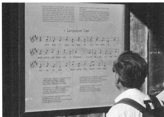
Auf den Spuren des Volksliedes (Sapün 2010).

Es ist bekannt, dass Komponisten gänzlich verschiedene Arbeitsweisen praktizieren. «Ich komponiere vor allem am Schreibtisch, aber ich probiere auch am Klavier, improvisiere, lese wiederum den Text, bis sich etwas konkretisiert. Das <Grobe> entsteht am Schreibtisch, Feinheiten namentlich klanglicher Art eher am Klavier. Besonders komplexere Klangverbindungen möchte man doch gerne am realen Klang durchhören.» Derungs bleibt trotz der Möglichkeiten der aktuellen Informatik bei der handschriftlichen Fixie-