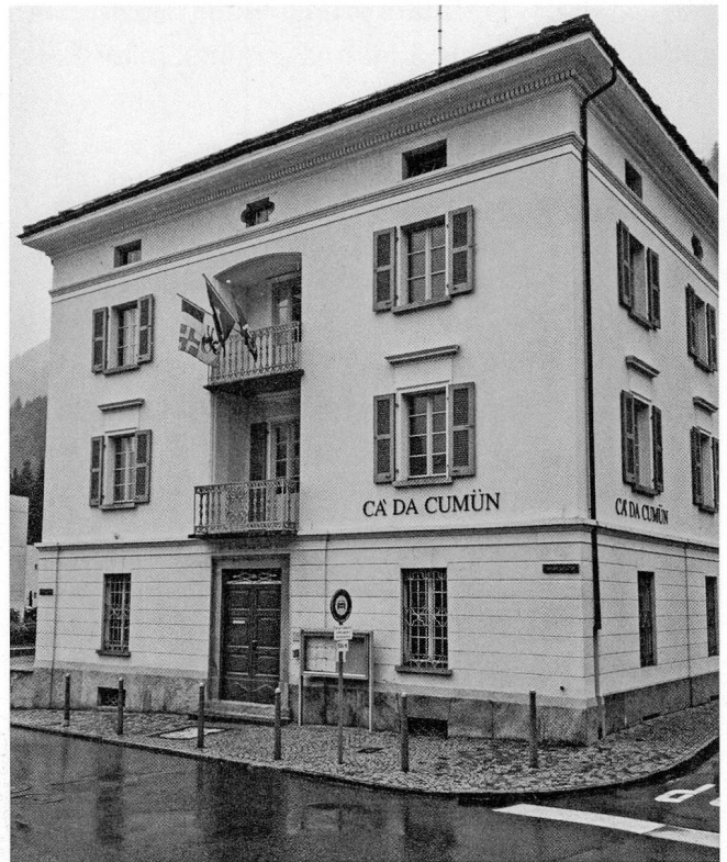
Ca' da Cumün, Poschiavo um 2010.

Mit den sich ab 1973 weitgehend ergebenden Gesetzesänderungen im Bereich des Zivil- und Bürgerrechts (Adoption, Anerkennung, Bürgerrecht, Ehe- und Namensrecht) veränderte sich das Berufsbild nicht nur auf dem Zivilstandsamt, sondern auch bei der Aufsichtsbehörde. Massgebend war das ab 1988 revidierte Eherecht, das Ehwirkungsrecht, verbunden mit markanten formellen Änderungen in der Registerführung. Dies hatte weitgehend einen Geschlechter- und Generationenwechsel zur Folge. Was den Generationenwechsel betrifft, so begründet sich dieser im Wesentlichen auf der eingeführten Amtsaltersbe-