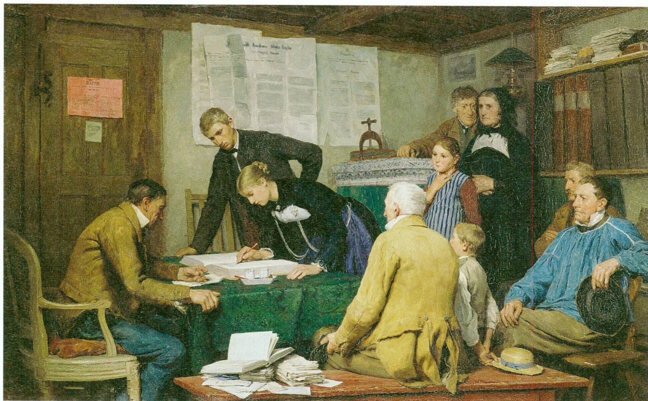
Albert Anker: Die Ziviltrauung, 1887, Öl auf Leinwand, 76,5 × 127 cm.

vierte Landessprache. Es setzte eine Welle an Vornamensänderungen ein, für welche ab 1969 die Regierung des Wohnsitzkantons anstelle des Heimatkantons zuständig war. Den Begehren wurden, abgesehen von wenigen Ausnahmen, nur im Kanton Graubünden stattgegeben. Andere Kantone verwiesen in ihren ablehnenden Entscheidungen auf ihre kantonalen Amts- und Landessprachen.