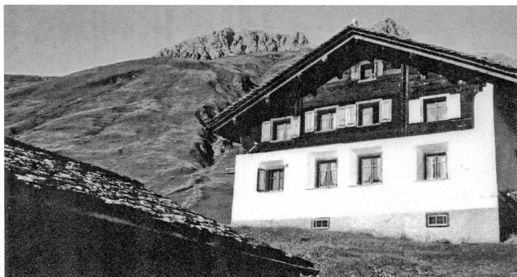
Zivildstandsamt Avers im Gallushaus, höchstgelegenes Zivildstandsamt von Graubünden auf 2100 müM.

Heim bleiben als schöne und dankbare Erinnerung. An einigen Orten war man auf diese Einladung geradezu angewiesen, war doch weit und breit kein Restaurant. Etwas heikel wurde es dann, wenn der Gastgeber im Irrglauben war, dem Gast aus Chur nichts Anständiges bieten zu können. In solchen Momenten war man froh, noch über einen zerkauten Kaugummi verfügen zu dürfen – eine etwas andere Form von Businesslunch. Die Aussage, wonach hinter einem Mann eine starke Frau steht, hat sich auch im Zivildstandswesen bestätigt. Herzhafte Plädoyers durch Ehefrauen wie «mein Mann handelt stets nach bestem Wissen und Gewissen», zeugen von Hingabe und Verbundenheit und jeder wäre ein Schuft, würde er darunter was anderes verstehen.