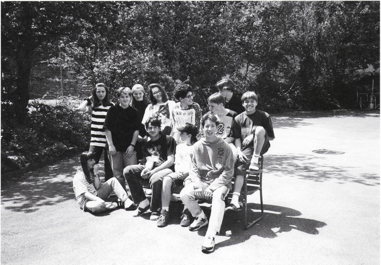
Jugendliche im Jahr 1993 vor dem Alpinen Progymnasium Flims.