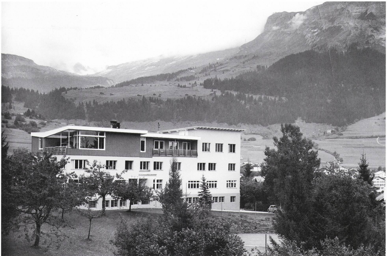
Alpines Progymnasium Flims, nach 1953.