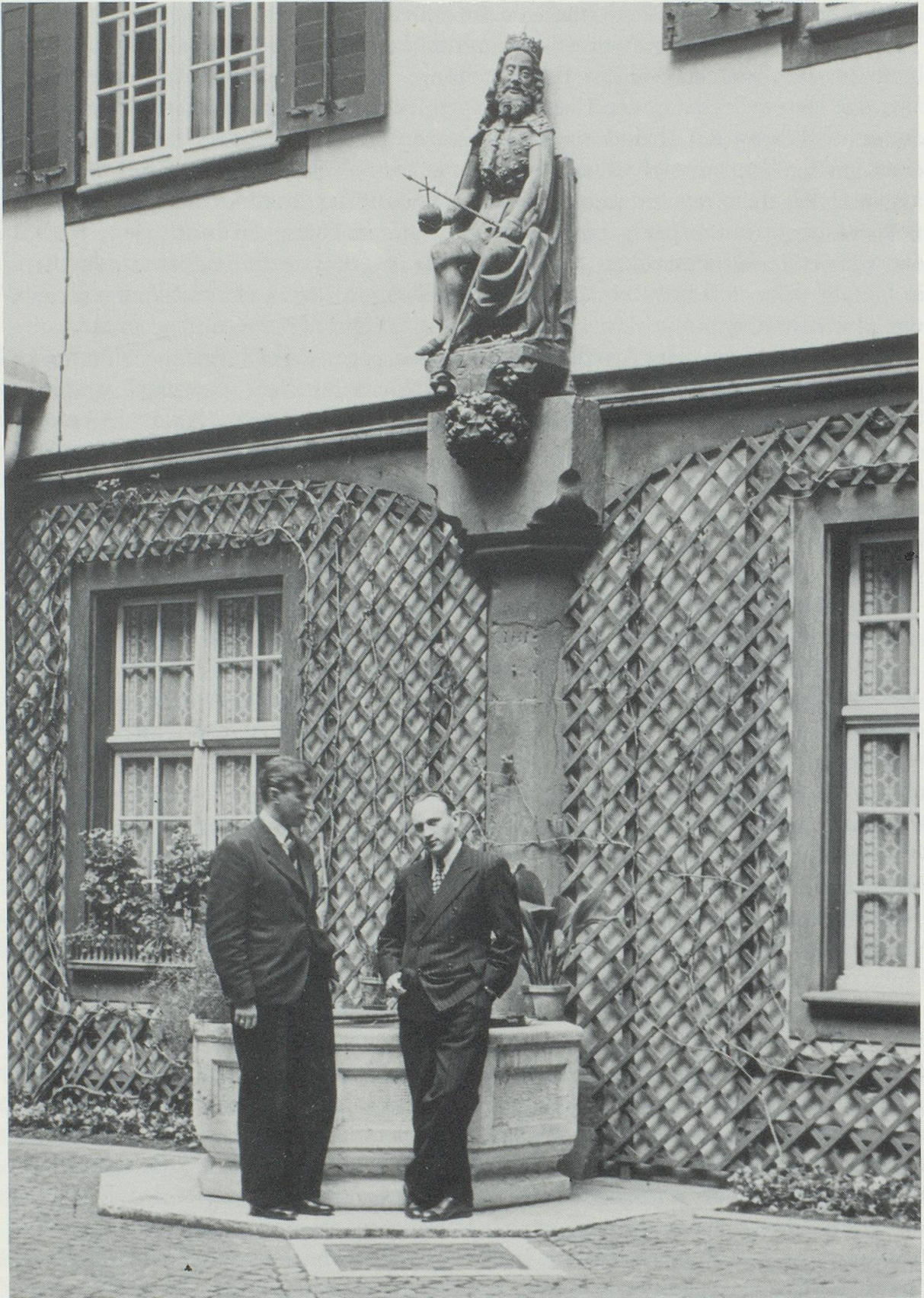
August Wenzinger und Paul Sacher im „Seidenhof“, Blumenrain 34, der die Schola Cantorum Basiliensis von 1935 bis 1940 beherbergte