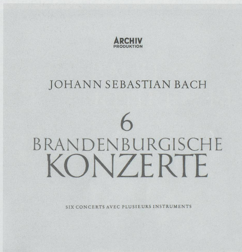
Abb. 1: Umschlagtitel des Beiheftes zu Archiv Produktion 14 107/08 APM.