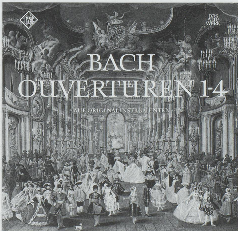
Abb. 4: Kassettentitel Telefunken SAWT 4509/10-A, veröffentlicht 1967/68.