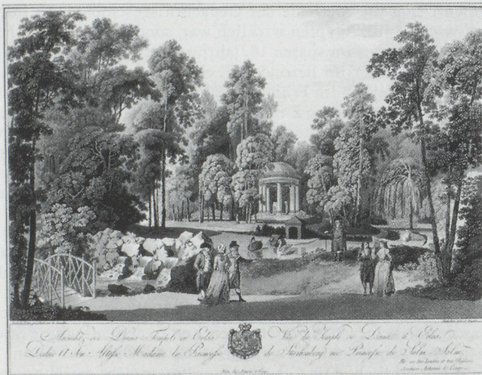
Abb. 1: Diana-Tempel von Erlaa, kolorierte Radierung von Johann Ziegler aus dem Anfang des 19. Jahrhunderts. 3

Der Rundtempel im Hintergrund, den wir auf vielen der frühen Bühnenbildentwürfe sehen, findet sich genau so in den Parks etwa von Wörlitz, Erlaa und Waldegg.