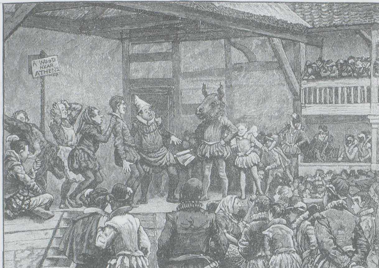
Abb. 1: Lithographie von Henry Marriott Paget, Ende 19. Jahrhundert, A Midsummer Night's Dream , III.1

verwendeten Ortsschilder – es gab auch Schilder mit dem Titel des Stückes oder dem Namen der Szene – scheiden das Spiel auf der Neutralbühne, die ganz Spielbühne ist, von möglicher Dekoration, trennen den Spielraum von einem nicht realisierten Schauraum. Das Schild „A wood near Athens“ erinnert die Zuschauenden daran, dass zuvor Lysander gegenüber Hermia den Wald (in 1.1) schon einmal als Treffpunkt bezeichnet hatte. 2 Der Wald selbst wird nicht angedeutet, nicht einmal durch ein Versatzstück, er muss ganz und gar imaginiert werden. Das Spiel ist dominant und wird durch Imagination beschleunigt. Bei klassizistisch gebildeten Zeitgenossen, die den Vorrang der bildenden Kunst oder der Literatur vor der Schauspielkunst betonen, stößt dies auf Ablehnung. So etwa bei Sir Philip Sidney in seiner Apologie for Poetrie :