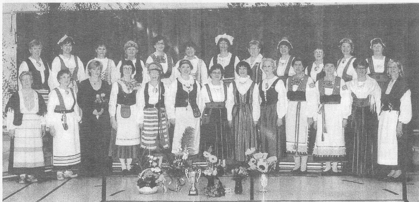
Frauenchor Orimatila, Finnland