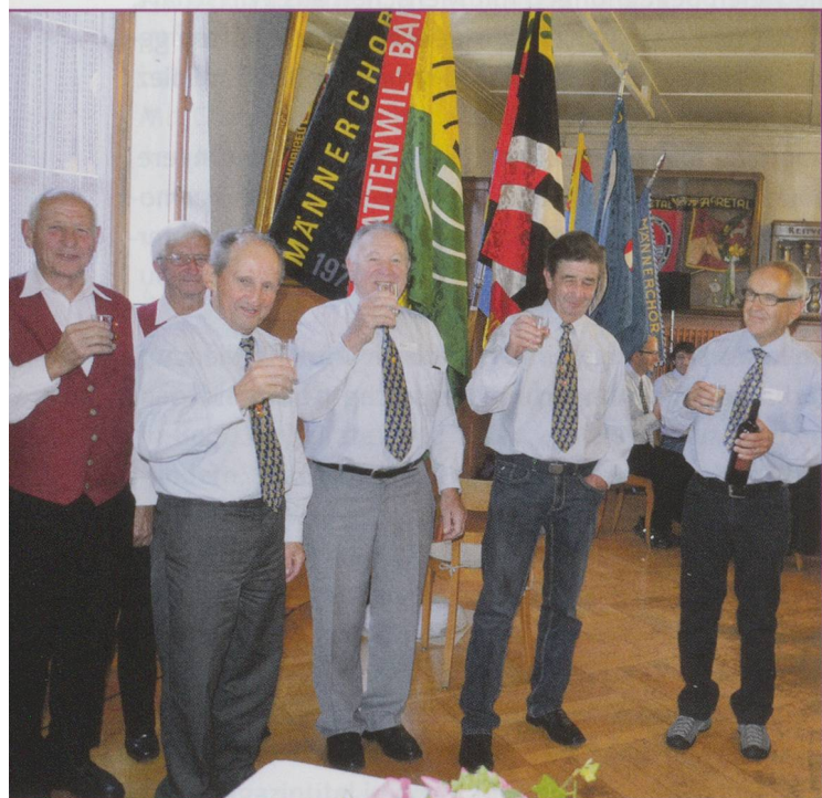
Gruppe 50+ Oberthal und Schlosswil.