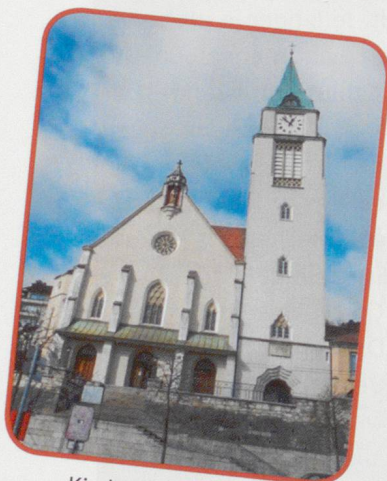
Kirche St. Maria Biel