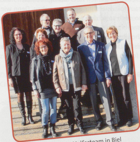
Das gesamte Helferteam in Biel