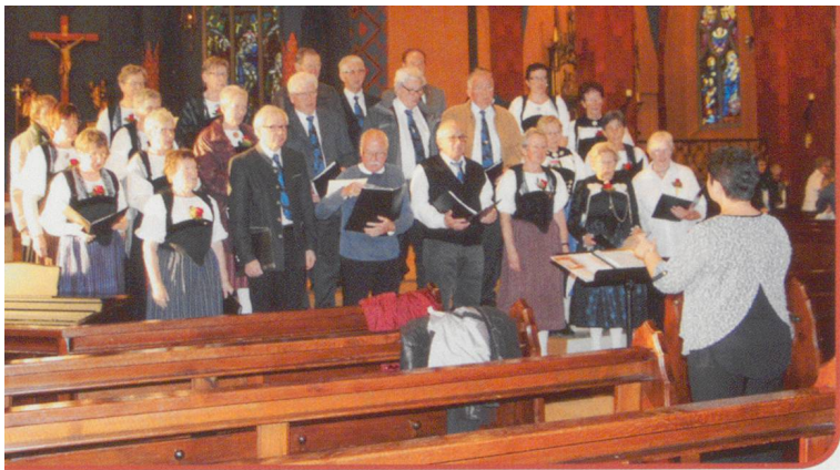
Gemischter Chor Zäziwil