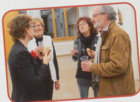
Ein verdienter Schluck zum Schluss