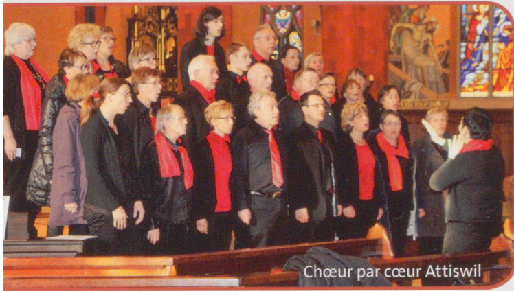
Chœur par cœur Attiswil