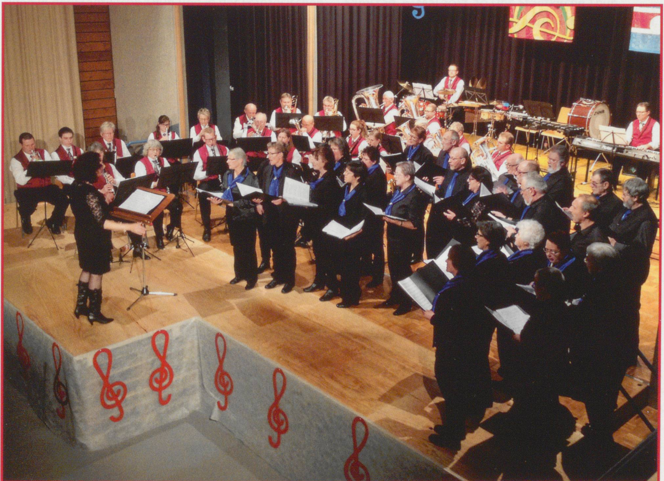
GC Graben-Berken und Musikgesellschaft Bannwil.

Die beiden Konzerte wurden für alle Beteiligten zu einem grossen Erfolg. Das Konzert am Samstagabend war so gut wie ausverkauft, und auch am Sonntagnachmittag haben viele Besucher den Weg durch das Schneegestöber in die Mehrzweckhalle Bannwil gefunden.