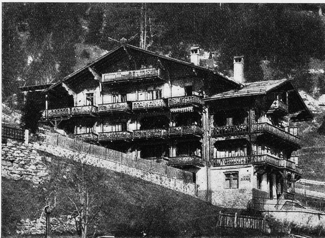
Villa Sana in Davos-Platz, Schwesternheim des Schweizerischen Krankenpflegebundes.

meuble, un petit jardin potager qui descend en gradins vers Davos, est cultivé par nos Sœurs qui ont su faire de ce petit coin de terre un lieu charmant, une ruche dont l'activité ne diminue que pendant l'été, et où les visiteurs et les visiteuses de notre association recevront toujours le meilleur accueil, qu'ils soient malades ou bien portants ! D r M l .