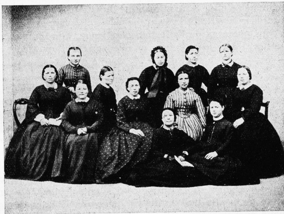
Une des premières volées d'élèves à La Source, vers 1865

L'auteur décrit alors la tâche que devront remplir les gardes visiteuses de paroisses, les gardes-malades privées en ville et les gardes hos-