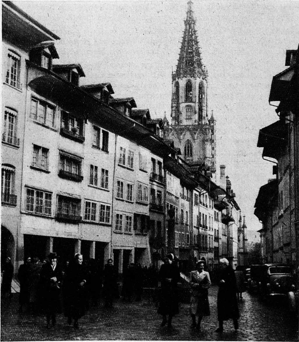
Nach der Predigt im Münster begeben sich Gäste und Schwestern ins Casino

Vor allem begrüße ich Euch, Ihr Schwestern vom Lindenhof, die Ihr von nah und fern gekommen seid, um Eurer Schule Eure Verbundenheit und Liebe zu bezeugen. In den 50 verflossenen Jahren ist durch Eure Hingabe, durch Eure strenge Arbeit, durch Eure gewissenhafte Pflichterfüllung der Ruf unserer Schule begründet worden. Ihr seid die lebendigen Träger, auf deren Schultern unsere Schule ruht, Ihr habt ihr durch Eure hilfbereiten Hände und durch den Einsatz Eures Herzens Namen und Achtung verschafft, und darum seid Ihr unsere verdientesten Ehrengäste, die ich in Dankbarkeit vor allen andern willkommen heisse.