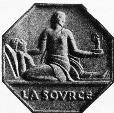
Insigne des infirmières diplômées de La Source

Tous les manuels d'histoire du nursing racontent comment Florence Nightingale ouvrit, en 1860, à Londres, sa fameuse école d'infirmières qui servit de modèle à beaucoup d'institutions semblables qui se fondèrent plus tard dans de nombreux pays. Plusieurs de ces manuels, toutefois, rappellent qu'un an plus tôt, à Lausanne, s'était ouverte une école qui peut se dire, à juste titre, la première en date de toutes les écoles d'infirmières du monde. C'est l'École normale évangélique de gardes-malades,