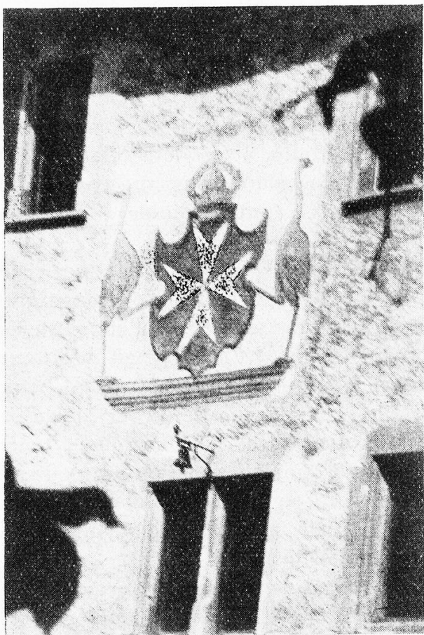
L'écusson de l'ordre de Saint Jean de Malte à son ancien hospice de Bubikon, canton de Zurich (Suisse)