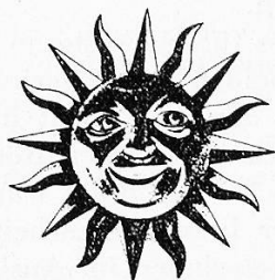
Le soleil héraldique de Sierre

Nach der freundlichen Begrüssung durch Damen und Herren des Komitees am Bahnhof, nahmen die einen der Gäste an der Konferenz der Präsidenten der Rot-