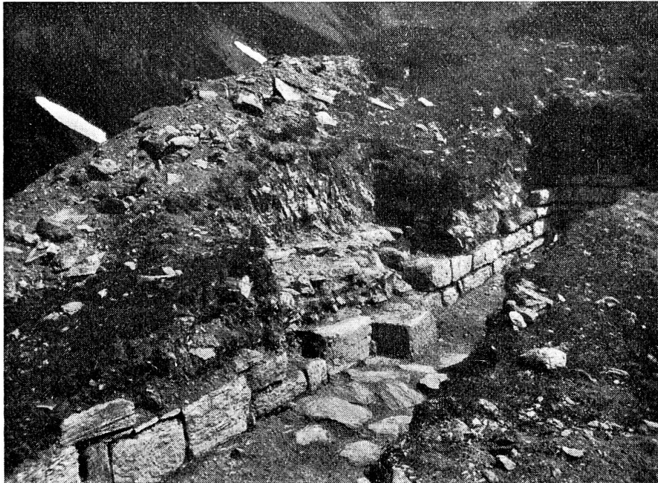
Abb. 3. Ostwand des Nordraumes. Mauermantel, Mauerkern, Sockel, Steinplatten-Bodenbelag.