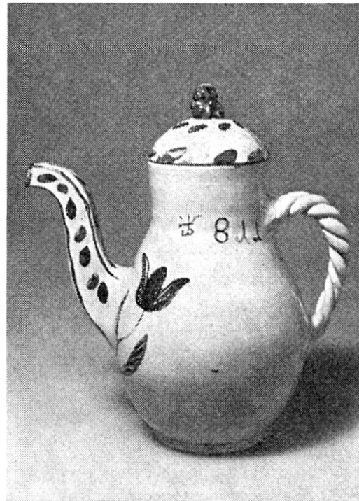
Abb. 5. P. Lötcher. Kaffeekrug. 1811