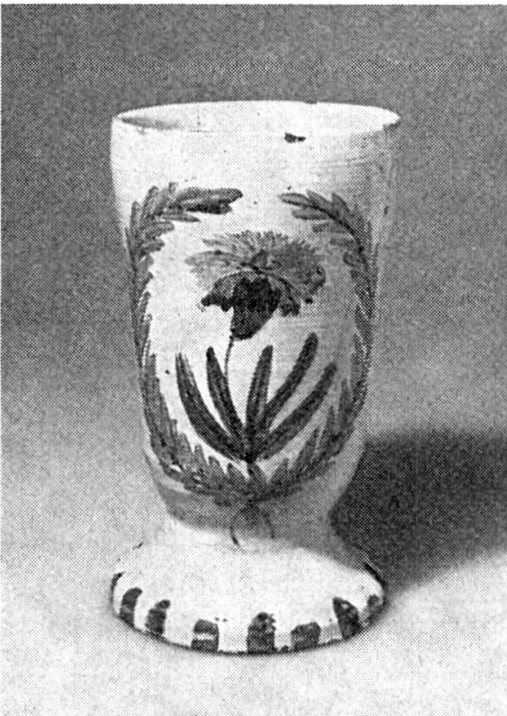
Abb. 4. P. Lötcher. Grosser Kelch. Um 1810