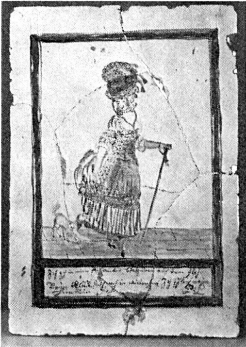
Abb. 2. P. Lötcher. Ofenkachel. Ende 18. Jh.