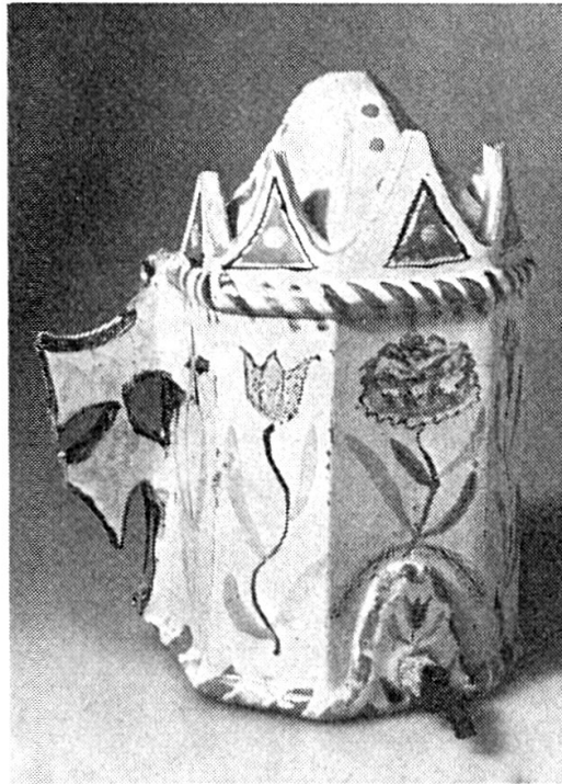
Abb. 3. P. Lötcher. Giessfass. Ende 18. Jh.