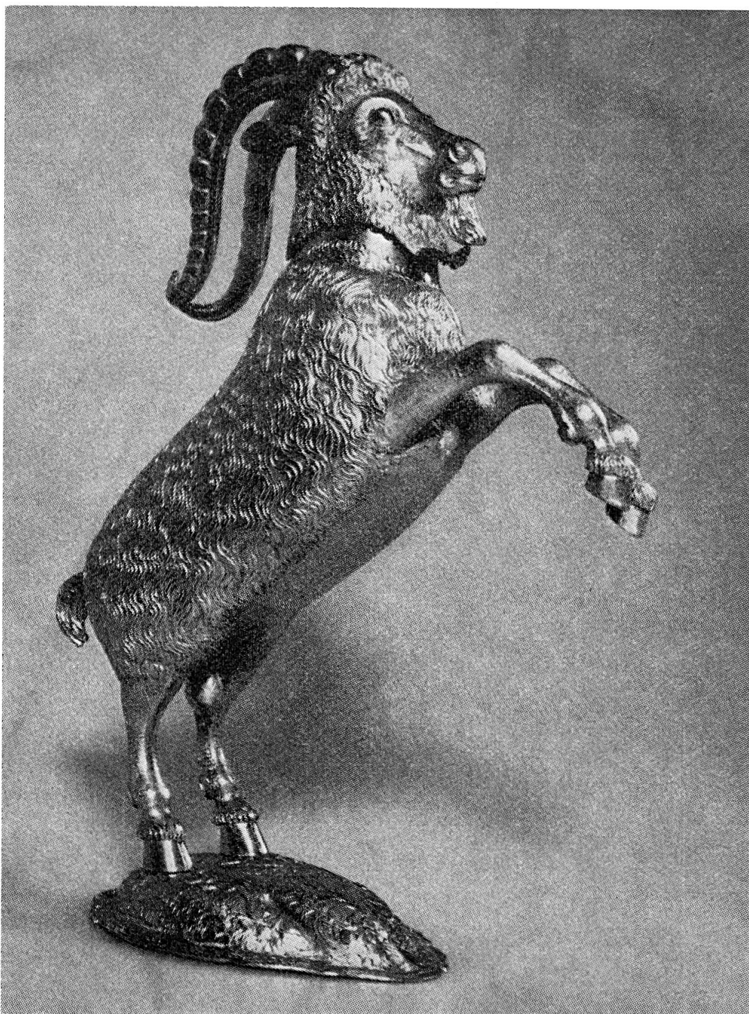
Bürgerbrecher in Form eines springenden Steinbockes mit abnehmbarem Kopf (Höhe 23,3 cm); Silber vergoldet, getrieben und ziseliert, ohne Meistermarke und ohne Beschaueichen; um 1675. Aus dem Churer Rathaus, heute im Rätischen Museum.