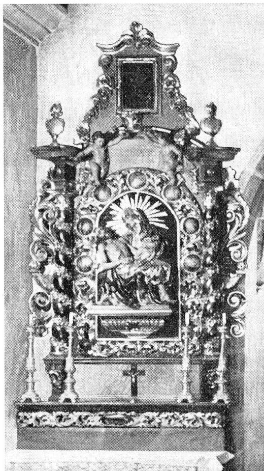
Muttergottes-Seitenaltar in Kuratkapelle Obersaxen-St. Martin, 1747 (?) vermutlich von Placi Schmet geschaffen. Medaillons mit Szenen der Schmerzen Mariae; Pietà modern; restauriert 1930. Foto 1939.