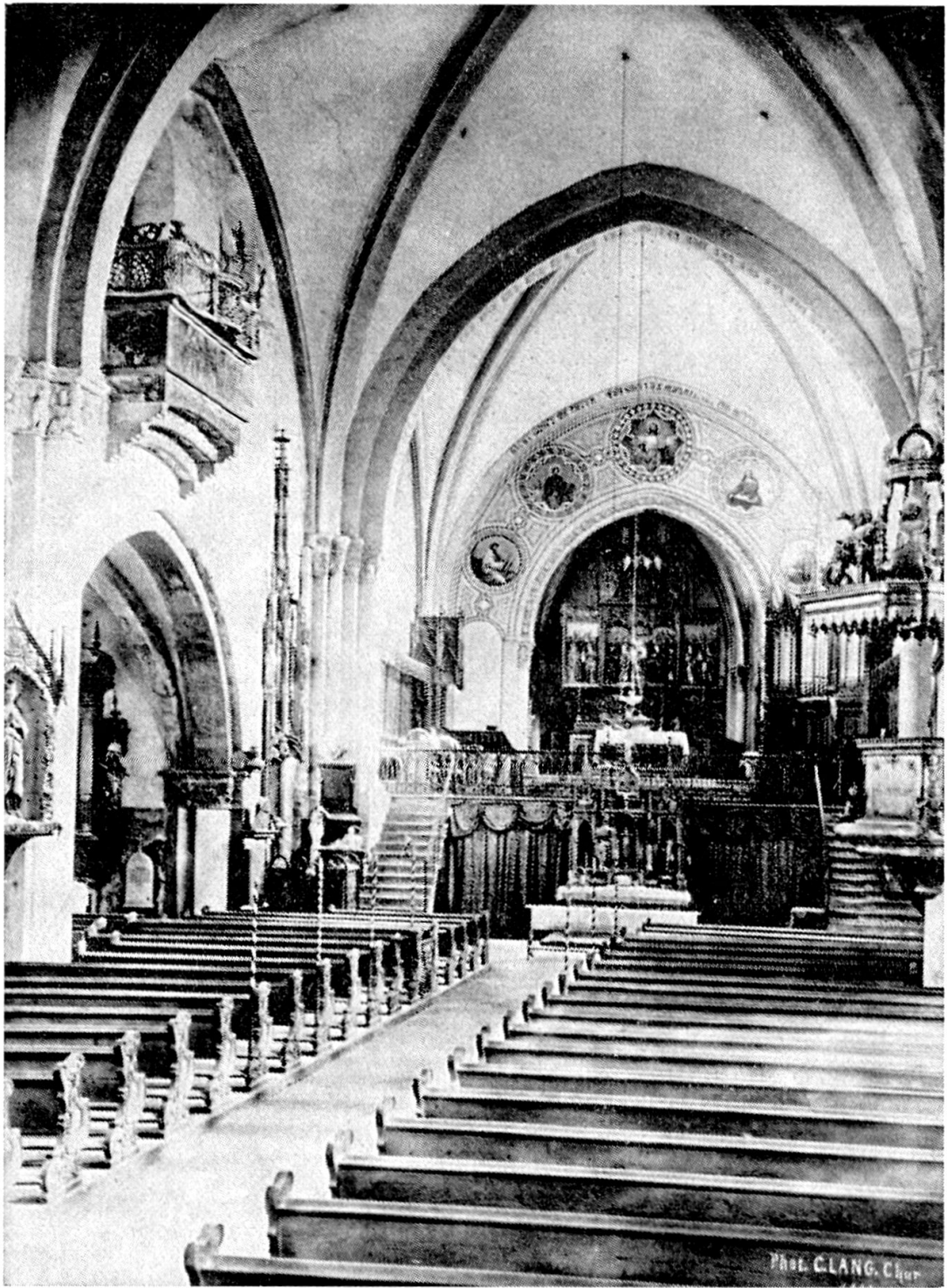
Kathedrale Chur, Innenansicht zum Chor. Foto Lang, 1885, Fotothek des kunstgeschichtlichen Seminars der Universität Zürich.