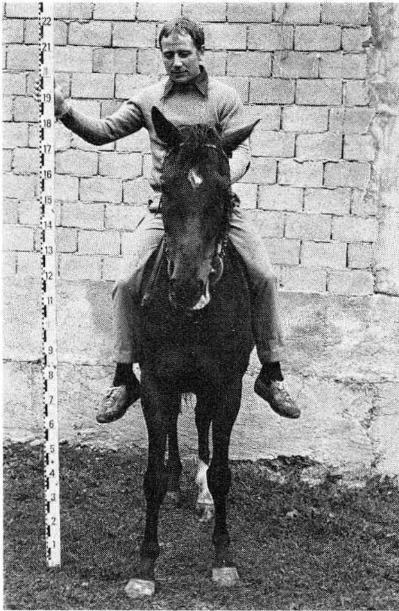
Bild 3: Reiter zu Pferd neben Messlatte als Beweis zu meiner Interpretation. Halten kann man sich am besten mit der Hand auf Schulterhöhe.