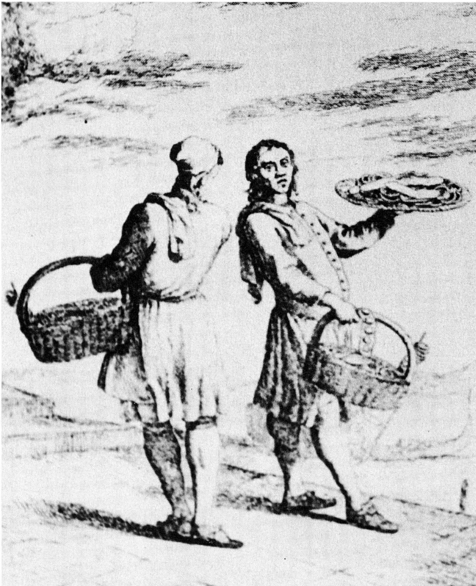
Zuckerbäcker. Auswanderung war durch die neue Ernährungs- situation nicht mehr lebensnot- wendig.

Oft wurden fettige und schwerverdauliche Mahlzeiten – wie etwa Holdermus – im Volk als gesund und kräftebildend betrachtet. 23 Wieweit diese Ansicht noch heutzutage verbreitet ist, gerade auf Kartoffelgerichte bezogen, scheint schwierig zu beurteilen.