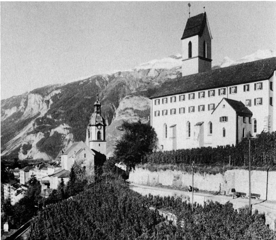
Bistum Chur: Viele Rebberge wurden zu Kar- toffeläckern.

volkskundlicher Sicht – neben der kommunikativen Wirkung auch magische Wirkung zukam und -kommt, kann hier nicht behandelt und beantwortet werden. Doch sollte in diesem Zusammenhang sowohl der sprachlichen Grussveränderungen, wie auch der Veränderung der Gestik Beachtung geschenkt werden. Diese Kurzkommunikationen oder Verbindungskommunikationen zu längeren Gesprächen beinhalten recht interessante Hinweise über Lebenseinstellung, Existenz usw. So sagt man etwa im Unterengadin: «vaina sü bella?/ kommen schöne (Kartoffeln aus dem Boden)?,» 32 oder in Breil «va 'i vinavon?/ geht es vorwärts?» 33 In Falera spricht man von «caveis truffels?/ grabt ihr Kartoffeln?» 34 In Ardez und Tschierv sagt man: «reda (redi) bain?/ gibt es gut aus?» 35 und in Vaz «betg bi samazza/ nur langsam (töte dich nicht gerade).» 36 Oft kommen in diesen Kommunikationsformen, die manchmal struktur- und inhaltsmässig den Kommunikationsformen über das Wetter ähneln, Spässe vor, die vermutlich die oberflächliche Kurzkommunikation vertiefen und auflockern. Im Engadin und im Münstertal spasst man, nachdem man gefragt hat, wie die Ernte aussieht: «i vegn ora mailinterra sco crappa/ es kommen (soviel) Kartoffeln zum Vorschein wie Steine.» 37 Manchmal, wenn die Kartoffeln sehr klein sind, spricht man auch von «crastognas/ Kastanien» oder von «frosclas, frosramenta, froslerverc/ Hagebutten.» 38