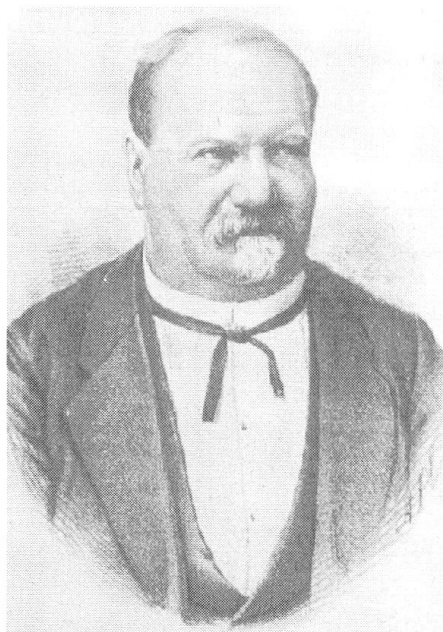
Abb. 4: 1892 stirbt Stän- derat Remigius Peterelli während der Wintersession in Bern.