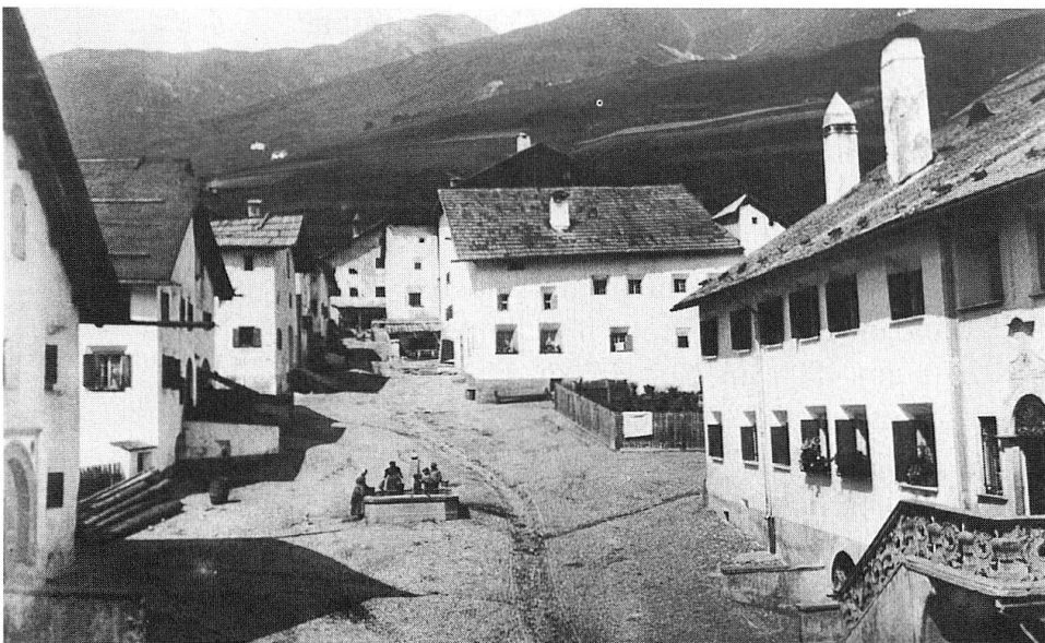
Die seit 1760 unter einem imposanten Satteldach vereinigten herrschaftlichen Häuser Nr. 27 (sog. unteres) und Nr. 28 (sog. oberes Plantahaus) bergen je einen weder im Burgenbuch von Graubünden noch im Inventar von Zuoz erwähnten, mittelalterlichen Wohnturm. Poeschel