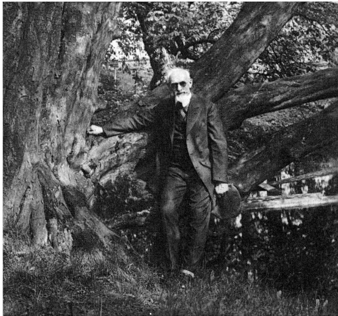
Paul Juon in Vevey