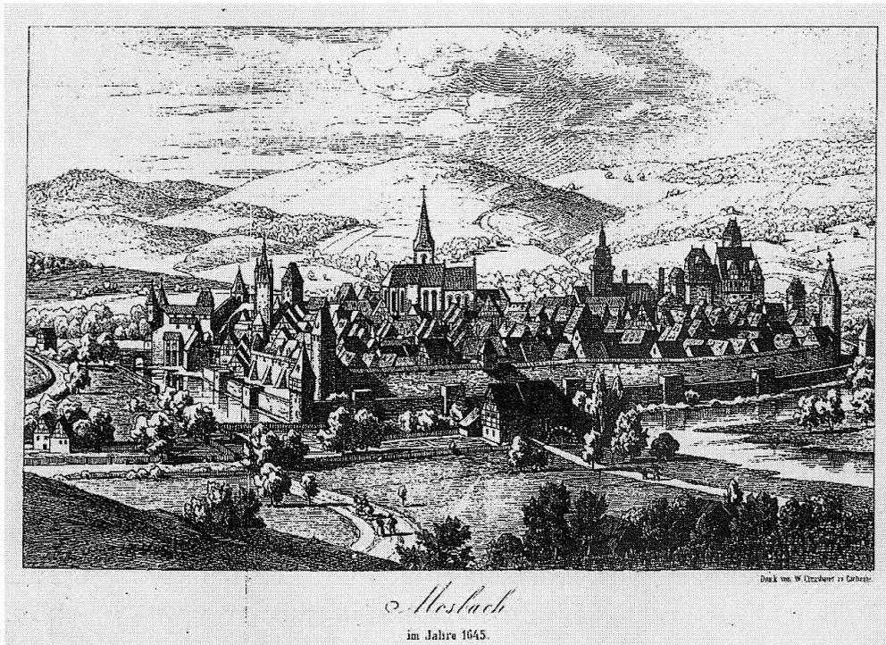
Mosbach im Jahre 1645. Druck des 19. Jahrhunderts nach einem alten Stich (Besitz des Verfassers)