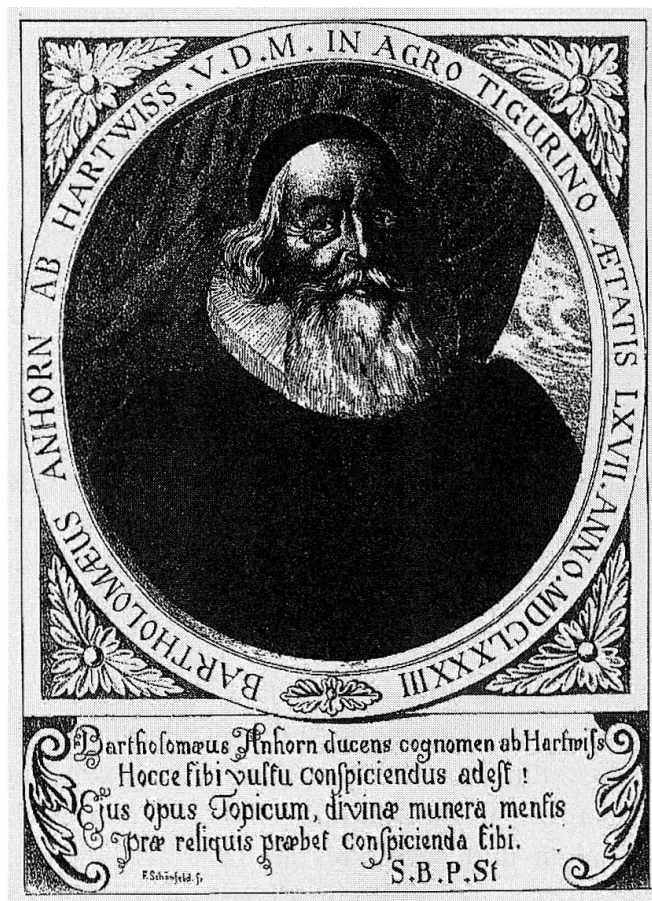
Bartholomäus Anhorn d. J. (1616–1700) Bild aus: Anhorn, Heilige Wiedergeburt, Brugg 1680 (Vorlage: Niedersächsische Staats- und Universitätsbibliothek Göttingen)