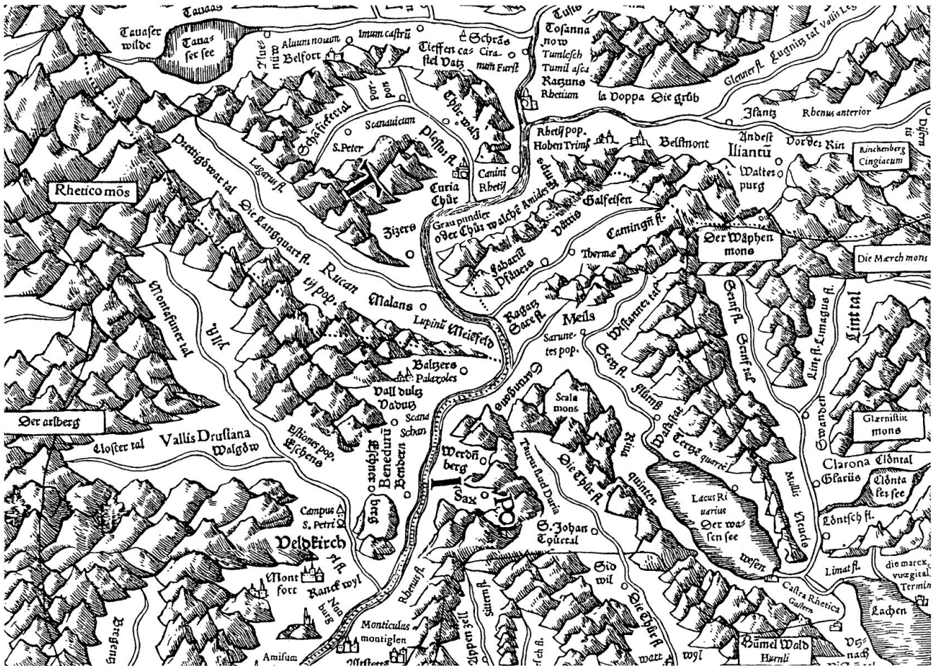
Abb. 5: Ausschnitt aus Tschudis Schweizerkarte.

hen hat, sondern auch in quantitativer. Insbesondere der Vergleich des RU mit dem von ihm ebenfalls kopierten Kollektivenverzeichnis legt jedenfalls nahe, dass der fragmentarische Charakter des Textes kaum auf Tschudi zurückzuführen ist. Lassen sich überdies noch weitere Informationen zur Gestaltung von Tschudis Vorlage gewinnen?