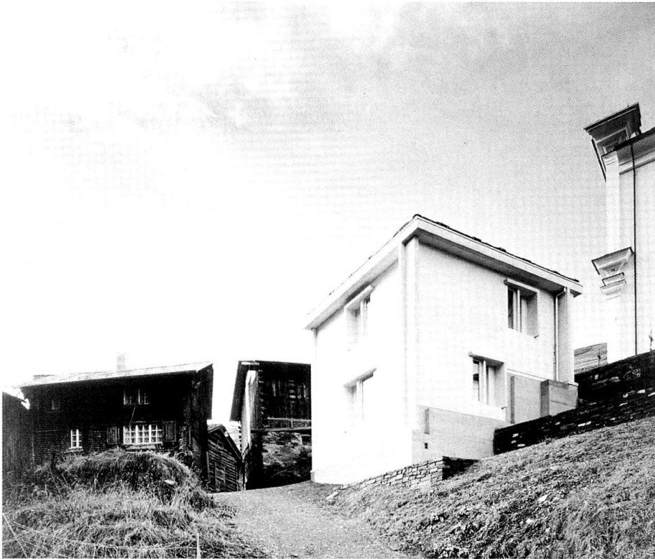
Die von Gion A. Caminada erbaute «Stiva da morts» in Vrin.