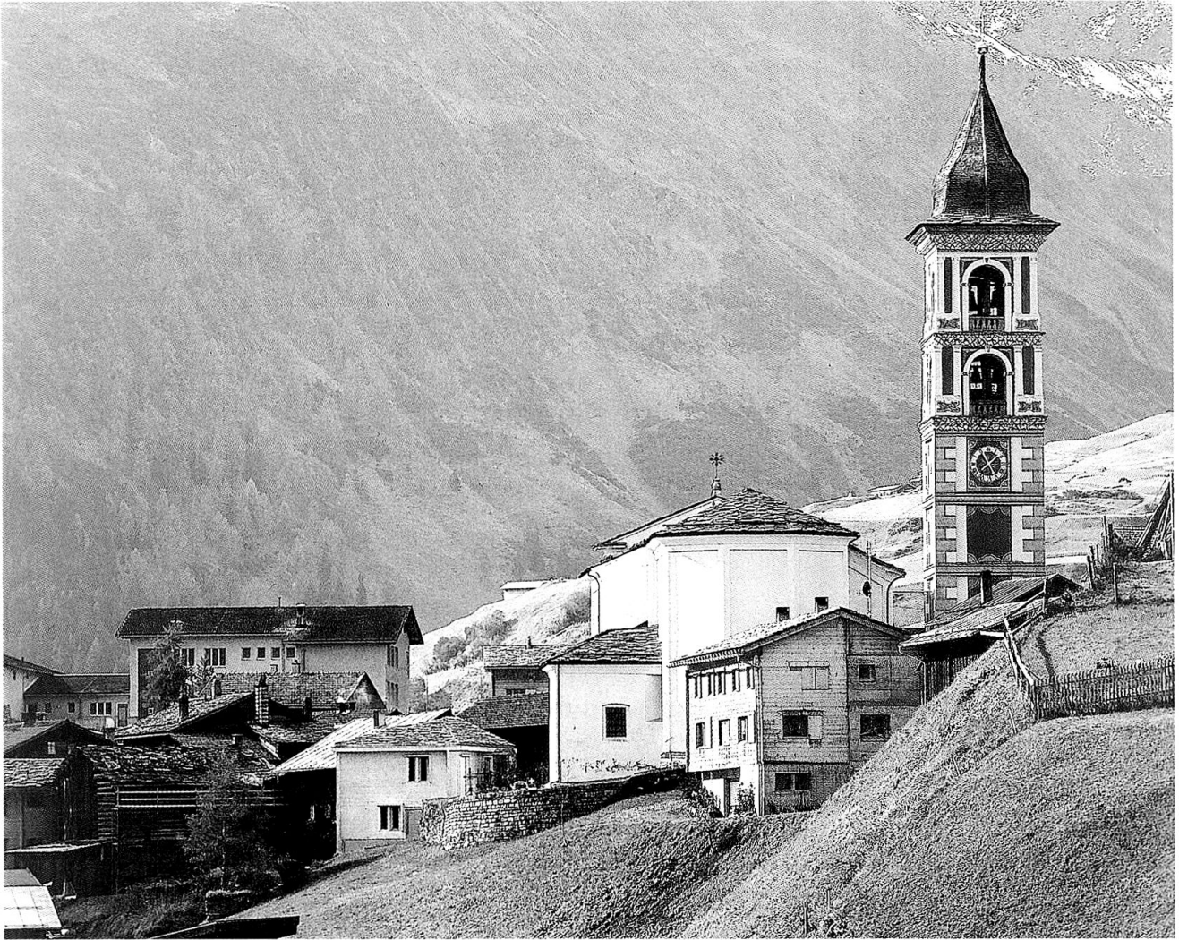
Die «Stiva da morts» in Vrin mit der Kirche im Zentrum des Dorfes.