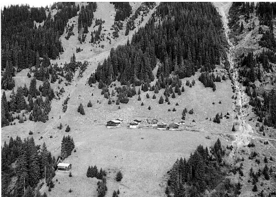
Val Bugnei (Tujetsch): Ein Muster der Waldausdehnung auf Parzellenstufe: Fichten wachsen in offenes Land.

In der Schweiz gibt das Verhältnis von Wald zu offenem Land seit langem zu grundsätzlichen Diskussionen Anlass. Ab dem Ende des 18. Jahrhunderts war es die allmähliche Verdrängung von Nutzungsrechten durch Eigentumsrechte 1 und die unter anderem damit verbundene Wald-Weide-Diskussion, die bis heute andauert. Heute ist es die Frage, wie unsere Kulturlandschaft – angesichts des Bodenverbrauches durch den Siedlungsbau, des Vorrückens des Waldes und veränderter landwirtschaftlicher Bewirtschaftung – aussehen soll. Diese Diskussionen waren und sind geprägt vom Blickwinkel des Betrachters.