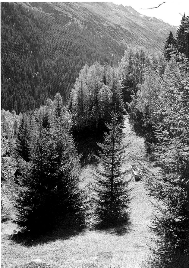
Einwachsende Wiesen oberhalb von Surrein (Val Tujetsch).

Wer hingegen einen weiteren Betrachtungsraum wählt, richtet auch auf der Suche nach Lösungen den Blick nicht mehr hauptsächlich auf die einzelbetriebliche, sondern auf die politische Ebene. So hat etwa der Bündner Grossrat Johannes Pfenninger zu bedenken gegeben, dass jede Landschaft einer Dynamik unterstellt sei und darum eine Bewirtschaftung benötige: 12 «Wir müssen für die Landwirtschaft, und speziell für diejenige im Berggebiet, gute Rahmenbedingungen schaffen, damit wir diese Kulturlandschaft in etwa so erhalten können.»