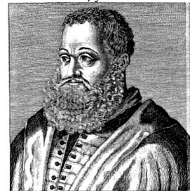
Hic est VERGERIVS, Roma qui missus ab urbe Germanos inter Pontificem celebrat. Tandem LUTHERVM laudat Christi que ministros: Atque Antichristum Pontificem esse probat.

Pietro Paolo Vergerio – wahrscheinlich nach einem zeitgenössischen Originalstich.