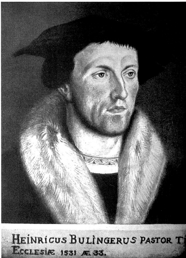
Heinrich Bullinger im Alter von 33 Jahren – unbekannter Künstler.

In der Reformationsgeschichte des Freistaates Gemeiner Drei Bünde nimmt die Einführung der Reformation in den Gemeinden des Engadins, dem Hochtal des Inns, eine besondere Rolle ein. 2 Für die entstehende reformierte Kirche des Freistaates war die Reformation der Gemeinden im Engadin von besonderer Wichtigkeit. Bis zum Ende des 16. Jahrhunderts entstand hier, mit der Ausnahme des Dorfes Tarasp im Unterengadin, das grösste geschlossene Gebiet reformierten Bekenntnisses im Freistaat Gemeiner Drei Bünde. Die Entwicklung, die dazu führte, verlief sehr kontrovers. In kaum einem anderen Teil des Freistaates wirkte sich die weitgehende Gemeindeautonomie 3 so