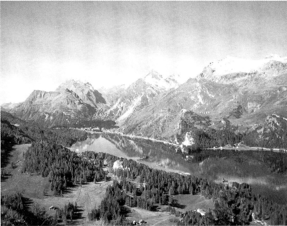
Blick über den Silser-See mit den Spiegelungen der Bergwelt auf der Wasseroberfläche.

«so still habe ich's nie gehabt, und alle 50 Bedingungen meines armen Lebens scheinen hier erfüllt zu sein». 62