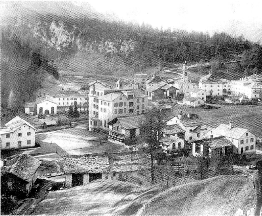
Fotografie von Sils-Maria um 1900, wo Friedrich Nietzsche von 1881 bis 1888 sieben Sommer im Haus Durisch (links hinten) wohnte.

verdanken, 58 – eingefangen zunächst mit flüchtigem Bleistiftstrich in mitgeführte Notizbücher. 59