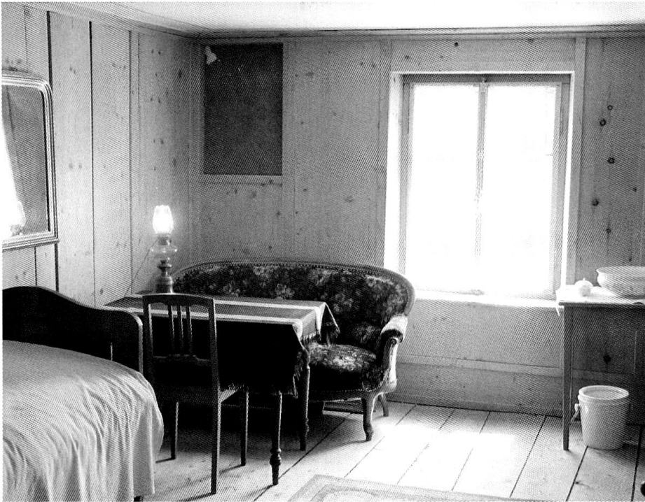
Die Stube im Haus Durisch, die Nietzsche sieben Sommer lang bewohnte.