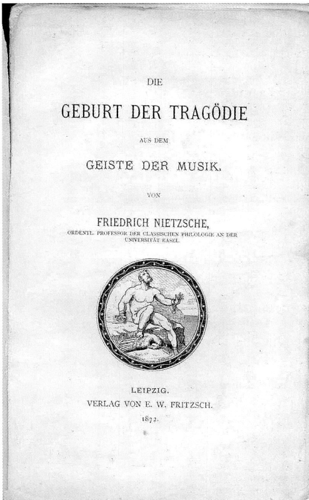
Titelbild der 1872 erschienenen Erstausgabe «Die Geburt der Tragödie aus dem Geiste der Musik» mit der Vignette des Ketten sprengenden Prometheus.

von Kunstverständnis, sondern vom Gesetz des «Sehens und Gesehenwerdens» regiert wird. Die Kunst schien hier nur mehr Anlass gesellschaftlicher Repräsentation von Hochadel und Finanzelite; zudem bewegte sich ein Teil der Wagner-Verehrer im Dunstkreis nationalpatriotisch-antisemitischer Gesinnungen, ein Anhang, mit dem Nietzsche keinesfalls verwechselt werden wollte. Rasende Kopfschmerzen und Augenprobleme verschaffen ihm die Legitimation für eine Flucht aus Bayreuth, wie sie ihn im selben Jahr auch dazu zwingen, seine Lehrtätigkeit für ein Jahr auszusetzen.