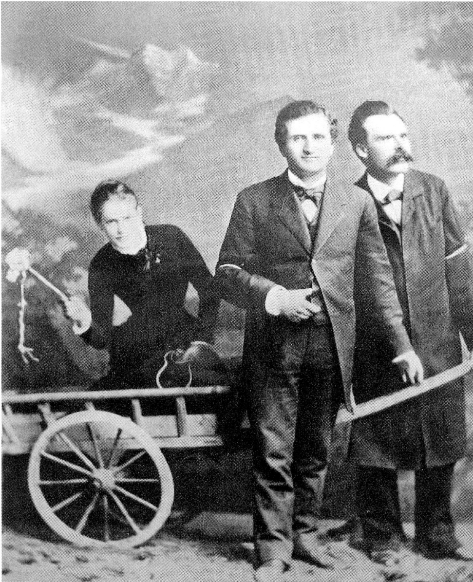
Friedrich Nietzsche (rechts) mit Lou Andreas-Salomé und Paul Rée.

hausrath.» Da plötzlich «lockt der Teufel <Schicksal> mit einer philologischen Professur». 4 Von seinem Lehrer und Mentor Ritschl in Vorschlag gebracht und dank philologischer Publikationen bereits wissenschaftlich ausgewiesen winken dem noch nicht einmal Promovierten nun plötzlich akademische Würden.